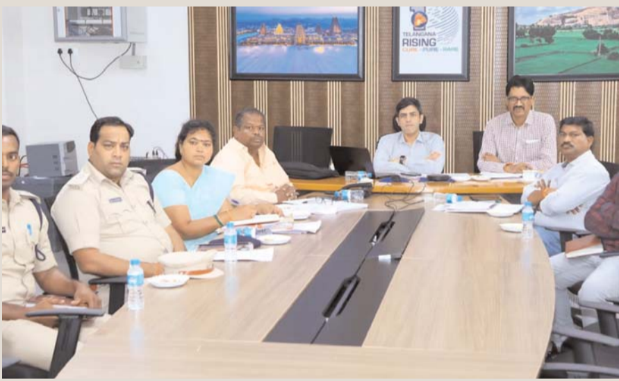
భువనగిరి మే 04 (ప్రజా జ్యోతి న్యూస్)

సర్కారు భూములే లక్ష్యంగా చెలరేగుతున్న అక్రమార్కులు ఎనగంటి తండ, పీపల్ పహాడ్, అల్లాపురంలో రెవెన్యూ పరిధిలో భూదోపిడీ అర్ధరాత్రి 12 దాటితే జేసీబిల జాతర.. టిప్పర్ల హోరు అధికారుల హెచ్చరికలు బేఖాతరు.. ఉక్కుపాదం మోపాలని ప్రజల డిమాండ్