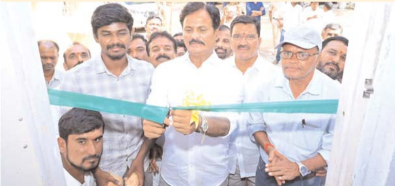
భూదాన్ పోచంపల్లి, మే 04 (ప్రజాజ్యోతి)