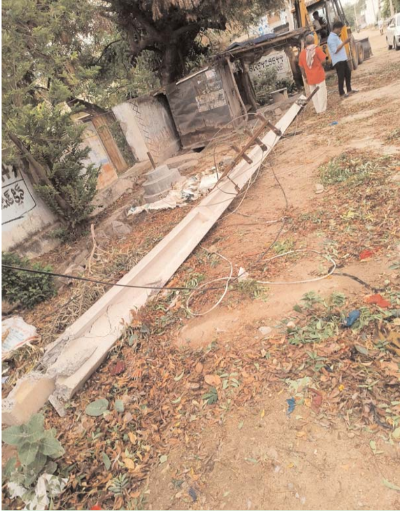
హాలియా, మే 3 (ప్రజా జ్యోతి)