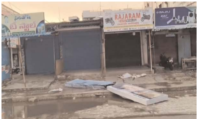
విరిగిపడిన చెట్లు, తెగిపడిన తీగలు