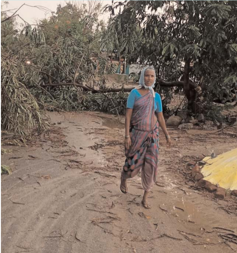
తుంగతుర్తి, మే 3, (ప్రజా జ్యోతి):

ఆదివారం సాయంత్రం అకాల వర్షం కురవడంతో పాటు భారీ ఈదురు గాలులకు మండల పరిధిలోని వెంపటి గ్రామంలో వీచిన ఈదురు గాలులు, అకాల వర్షాల ప్రభావంతో పలుచోట్ల చెట్లు విరిగి రోడ్లపై అడ్డంగా పడిపోయాయి. దీంతో రాకపోకలకు తీవ్ర అంతరాయం ఏర్పడింది. ఈ విషయం తెలిసిన వెంటనే గ్రామ