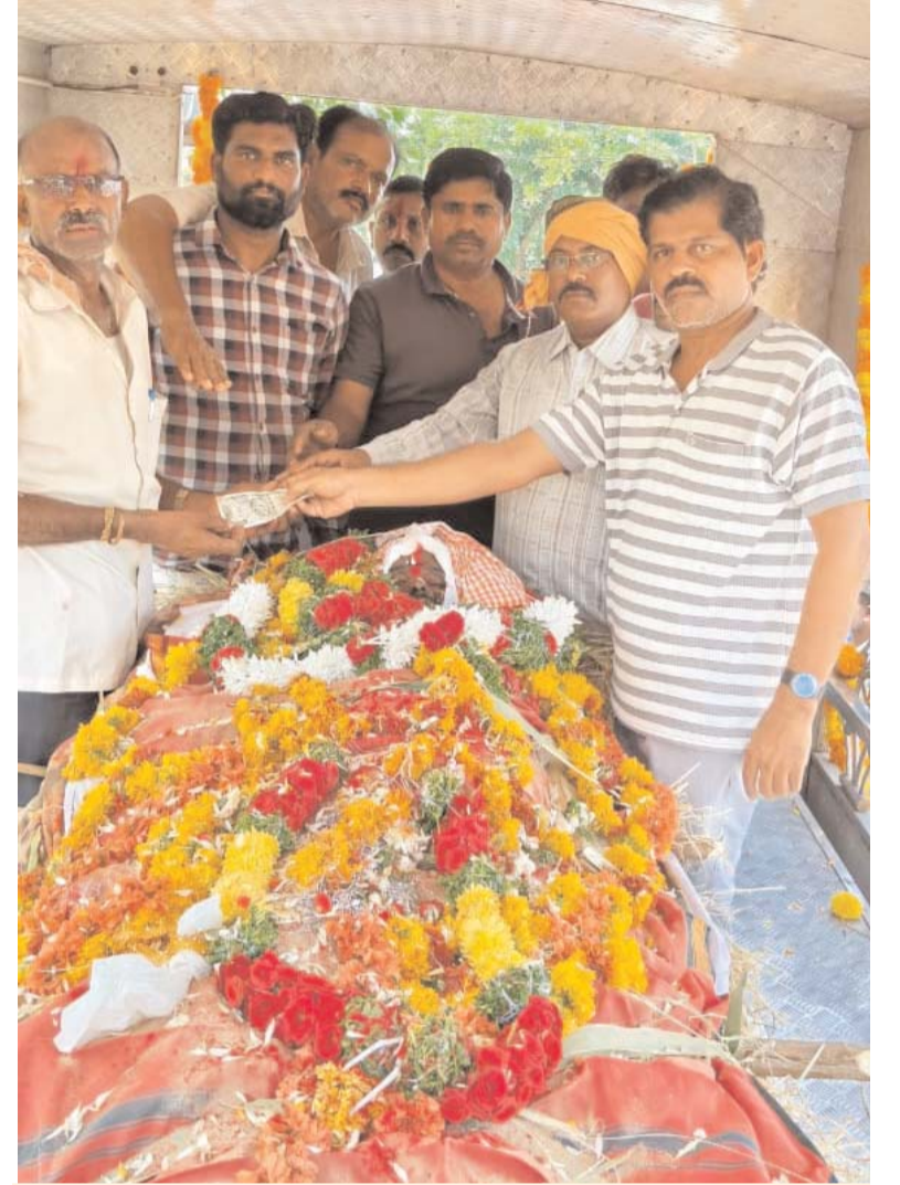
చిట్టాల మే 03 (ప్రజాజ్యోతి ప్రతినీధి):