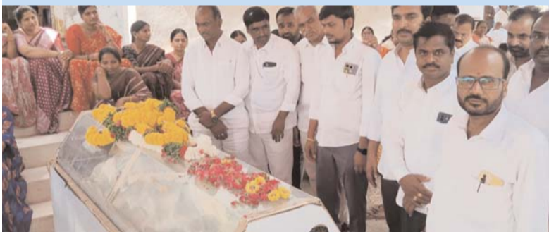
భూదాన్ పోచంపల్లి, మే 01 (ప్రజాజ్యోతి)