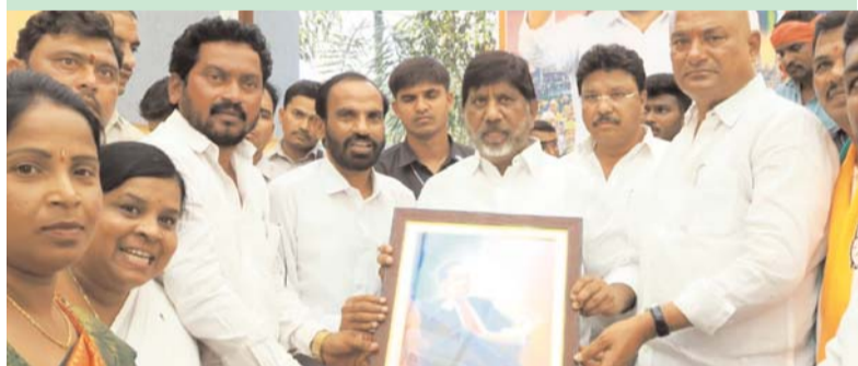
మిర్యాలగూడ, మే 01, ( ప్రజాజ్యోతి ):

డిప్యూటీ సీఎం భట్టి ని కలిసి మాల మహానాడు నాయకులు