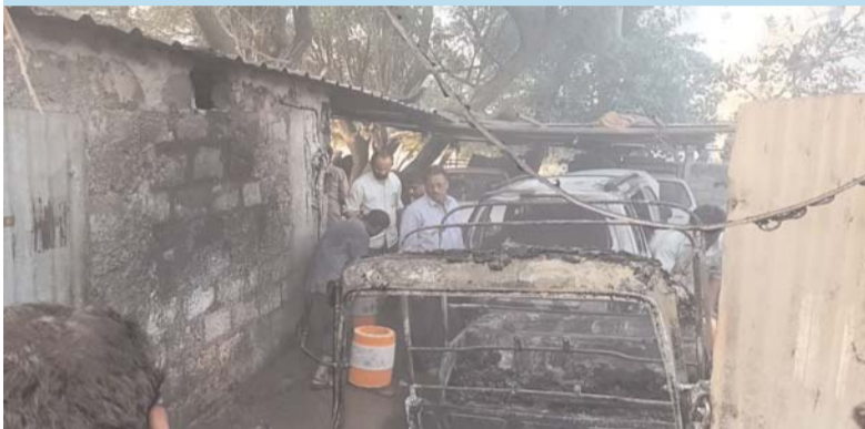
కారు, ఆటోతో పాటు ఫర్నిచర్ దగ్ధం

మిర్యాలగూడ, మే 01, ( ప్రజాజ్యోతి ):నల్గొండ జిల్లా మిర్యాలగూడ పట్టణంలోని హనుమాన్ పేట షెడ్యూల్డ్ సమీపంలో