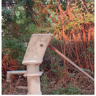
వెచ్చించాలని. దళితులు ప్రభుత్వాన్ని డిమాండ్ చేస్తున్నారు.

(మొదటి పేజీ తరువాయి) వర్షాకాలంలో తీవ్ర గాలి వర్షాలకు విద్యుత్ నిలిచిపోయి ఇళ్లలోనికి విద్యుత్తు నిలిచిపోయి అంధకారంలో దళితులు అల్లాడని రోజులు లేకపోలేదు. దళిత వాడల అభివృద్ధికి ప్రభుత్వం ఎస్సీ ఎస్టీ సబ్ ప్లాన్ నిధులు విడుదల చేస్తుంది. ఆ నిధులు దళితవాడల్లో అభివృద్ధికి సంబంధిత అధికారులు ప్రజాప్రతినిధులు సక్రమంగా వినియోగించక కనీస వసతులు లేక అభివృద్ధికి ఆమడ దూరంలో అంధకారంలో దళితవాడలో ని దళితులు కాలం వెళ్ళదీస్తున్నామని ఆవేదన వ్యక్తం చేస్తున్నారు. కొన్ని గ్రామాల్లో దళిత సర్పంచులు ఉన్నప్పటికీ, ఎస్సీ ఎస్టీ సబ్ ప్లాన్ నిధులతో పని చేయడం లేదు. నిధులన్నీ గ్రామ అభివృద్ధికి కేటాయిస్తూ దళితులైన బీసీలైన మరే కులాస్తులు సర్పంచ్ అయినా దళితవాడలను పట్టించుకోవడం లేదు. పర్యవేక్షించవలసిన సంబంధిత అధికారులు, ఏమీ పట్టనట్లు వ్యవహరిస్తున్నారని పలువురు విమర్శిస్తున్నారు. స్వతంత్రం వచ్చి 79 సంవత్సరాలు గడుస్తున్న దళిత వాడలు అభివృద్ధికి ఆమడ దూరంలో ఉన్నాయి. ఇప్పటికైనా సంబంధిత అధికారులు గ్రామాల్లో గల దళిత వాడలను సందర్శించి, అభివృద్ధి పనులు చేపట్టాలని, ప్రభుత్వం చర్య తీసుకొని ఎస్సీ ఎస్టీ సబ్ ప్లాన్ నిధులు