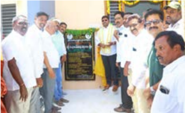
గంగాధర ఏప్రిల్ 08