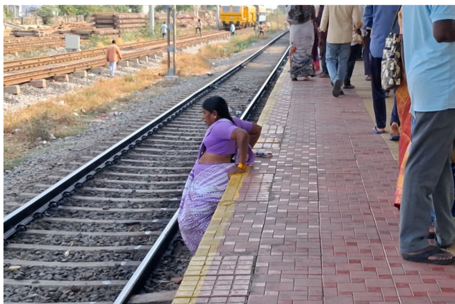
ఆగిన రైలు బోగీల కింద నుంచి ప్రయాణం :

మెదటి పేజీ తరువాయి రెండు కిలోమీటర్ల దూరం తగ్గించుకోవాలనే ఉద్దేశంతో ఈ ప్రమాదకర మార్గాన్ని ఎంచుకుంటూ రైల్వే భద్రతా నియమాలను పూర్తిగా విస్మరిస్తున్నారు. ప్రత్యేకంగా రైలు నిలిచిన సమయంలో బోగీల కింద నుంచి దాటే ఘటనలు తరచూ జరుగుతున్నాయి. రైలు ఎప్పుడైనా అకస్మాత్తుగా కదిలే ప్రమాదం ఉండటంతో ఇది ప్రాణాంతకంగా మారే అవకాశం ఉందని స్థానికులు ఆందోళన వ్యక్తం చేస్తున్నారు. చిన్నపిల్లలు, వృద్ధులు కూడా ఇదే మార్గాన్ని వినియోగించడం మరింత ఆందోళనకరంగా మారింది. ఫుట్ ఓవర్ బ్రిడ్జ్ లేకపోవడం వల్ల ప్రత్యామ్నాయం లేక ఈ ప్రమాదకర మార్గాన్ని ఆశ్రయిస్తున్నామని వారు తెలిపారు. అధికారులు స్పందించకపోతే ఎప్పుడైనా విషాదం సంభవించే అవకాశం ఉందని ప్రజలు ఆవేదన వ్యక్తం చేస్తున్నారు.