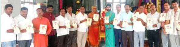
అల్వార్ ఏప్రిల్ 3 (ప్రజా జ్యోతి) అల్వార్ పట్టణంలోని శ్రీవాసవి కన్యకాపరమేశ్వరి నగరేశ్వరి స్వామి దేవాలయంలో శుక్రవారం ప్రథమ వార్షికోత్సవానికి సంబంధించిన ఆహ్వానపత్రక ఆవిష్కరణ కార్యక్రమం ఘనంగా నిర్వహించారు. ఈ సందర్భంగా దేవాలయాన్ని అందంగా అలంకరించి ప్రత్యేక పూజలు నిర్వహించారు. అలయ కమిటీ సభ్యులు మాట్లాడుతూ, ఈ నెల 25వ తేదీ శనివారం నుండి 27వ తేదీ సోమవారం వం - కు ప్రథమ వార్షికోత్సవ వేడుకలు వైభవంగా జరుగుతున్నట్లు తెలిపారు. ఈ ఉత్సవాల్లో వివిధ ఆధ్యాత్మిక కార్యక్రమాలు, ప్రత్యేక పూజలు, హోమాలు నిర్వహించనున్నట్లు వెల్లడించారు. భక్తులు, పురజనులు అధిక సంఖ్యలో పాల్గొని దేవాలయ ఉత్సవాలను విజయవంతం చేయాలని వారు కోరారు. ఈ కార్యక్రమంలో అలయ కమిటీ, నిర్వహణ సభ్యులు మరియు స్థానిక భక్తులు పాల్గొన్నారు.