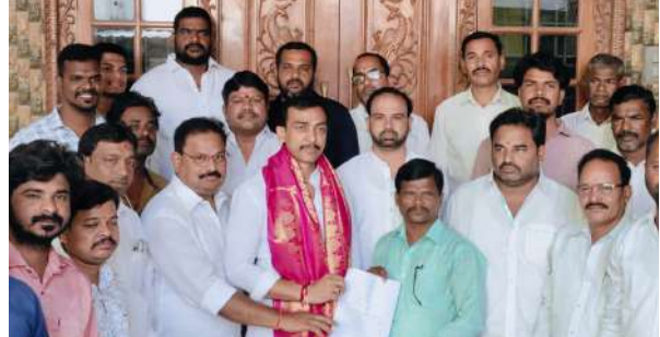
మంజూరు. 6. ఉప్పల్ డివిజన్ లోని శేషసాయి నగర్ లో అంతర్గత రహదారుల నిర్మాణానికి రూ. 45 లక్షల నిధులు మంజూరు ఈ కార్యక్రమం లో చిలకనగర్ వడ్డెర సంఘం నాయకులు చిలకనగర్ కురుమ సంఘం నాయకులు ఉప్పల్ శేషసాయి వెల్డేర్ అసోసియేషన్ సభ్యులు భీరప్ప గడ్డ దేవాలయం సభ్యులు, రామంతాపూర్ భారత్ నగర్ కాలనీ సభ్యులు రామంతాపూర్ ఇందిర నగర్ కాలనీ వాసులు రామంతాపూర్ బిలుకానగర్ కాంగ్రెస్ పార్టీ నాయకులు పాల్గొన్నారు