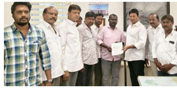
అల్వాల్, ఏప్రిల్ 3 (ప్రజా జ్యోతి) మల్లారాజ్ గిరి ఎమ్మెల్యే మల్లారాజశేఖర్ రెడ్డి గారి

- ఎమ్మెల్యే మల్లారాజశేఖర్ రెడ్డి చేతుల మీదుగా 9 మందికి రూ. 3.72 లక్షల సహాయం