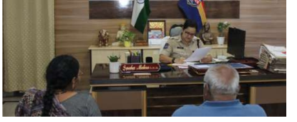
కార్యాలయాన్ని సంప్రదించవచ్చని సూచించారు. ప్రజావాణి ద్వారా వచ్చిన ప్రతి వినతిని కంప్యూటరైజ్ చేసి, వాటి పురోగతిని నిరంతరం పర్యవేక్షిస్తామని పేర్కొన్నారు.

- ఎస్పీ స్నేహ మెహ్రా వికారాబాద్ ప్రతీనిధి, ఏప్రిల్ 27 (ప్రజా జ్యోతి): జిల్లా పోలీస్ కార్యాలయంలో నిర్వహించిన "ప్రజావాణి" కార్యక్రమంలో భాగంగా ఎస్పీ స్నేహ మెహ్రా, ప్రజల నుంచి వచ్చిన ఫిర్యాదులను స్వయంగా స్వీకరించి వారి సమస్యలను తెలుసుకున్నారు. బాధితులతో నేరుగా మాట్లాడిన ఆమె, సంబంధిత ఎస్ఐ ఛీఫ్ ఓఫీస్లో సంప్రదించి కేసుల ప్రస్తుత స్థితిగతులను పరిశీలించారు. ఫిర్యాదులను సమగ్రంగా పరిశీలించిన అనంతరం బాధితులకు తగిన సహాయం అందిస్తామని హామీ ఇచ్చారు. ప్రతి ఫిర్యాదుపై పారదర్శకంగా విచారణ జరిపి త్వరితగతిన న్యాయం చేయాలని అధికారులను ఆదేశించారు. ఈ సందర్భంగా ఎస్పీ మాట్లాడుతూ, ప్రజల ఫిర్యాదులను స్వీకరించేందుకు పోలీస్ శాఖ ఎల్లప్పుడూ సిద్ధంగా ఉంటుందని తెలిపారు. ప్రజలు నేరుగా ఎస్పీ