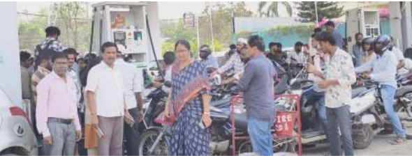
కృత్రిమ కొరత ఏర్పడిందని తెలిపారు. అదేవిధంగా పెట్రోల్ బంకులు యజమానులు సమీక్షలో భాగంగా మాట్లాడుతూ... ఆయిల్ కంపెనీలు కొంత సరఫరాను పెంచితే ఎలాంటి ఇబ్బంది ఉండదని తెలిపారు.