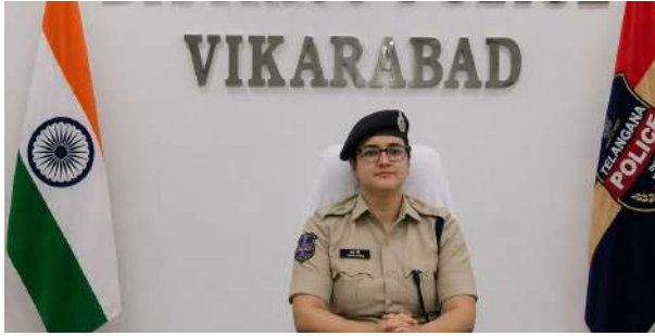
వికారాబాద్ ప్రతినిధి, ఏప్రిల్ 27 (ప్రజా జ్యోతి): ప్రజా పాలన -- ప్రగతి ప్రణాళిక '99 రోజుల క్యాంపెయిన్ లో భాగంగా వికారాబాద్ జిల్లా పోలీస్ శాఖ వినూత్న కార్యక్రమానికి

శ్రీకారం చుట్టింది. సమాజంలో సామాజిక న్యూనత పెంపొందించేందుకు జిల్లా స్ట్రామ్ షార్ట్ ఫిల్మ్ పోటీలను నిర్వహిస్తున్నట్లు ఎస్పీ స్నేహ మెహ్రా తెలిపారు. “సేఫ్ యూత్ -- స్ట్రాంగ్ నేషన్” నినాదంతో నిర్వహించే ఈ పోటీలు ఏప్రిల్ 27 నుంచి మే 2 వరకు కొనసాగుతున్నాయి. సైబర్ క్రిమి నివారణ, మహిళలు--పిల్లల రక్షణ, డ్రగ్స్ దుప్రభావాలు, ట్రాఫిక్ నిబంధనలు, ఏటీఎం, జాబ్, గిఫ్ట్ మోసాలు, న్యాయ విజ్ఞానం, ఆత్మహత్యల నివారణ వంటి అంశాలపై 2--3 నిమిషాల లఘు చిత్రాలను రూపొందించాలి. జిల్లాలోని యువత, విద్యార్థులు, కంటెంట్ క్రియేటర్లు పాల్గొనవచ్చు. ఎంపికైన టాప్-5 చిత్రాలకు నగదు బహుమతులు, ప్రశంసాపత్రాలు అందించడంతో పాటు ప్రజా ప్రదర్శనకు అవకాశం కల్పించనున్నారు. పోటీదారులు తమ వీడియోలను పేరు, ఫోన్ నంబర్ తో కలిపి 9948542227 నంబర్ కు వాట్సాప్ ద్వారా పంపాలి. మరిన్ని వివరాలకు 8712670020 నంబర్ ను సంప్రదించవచ్చు. కెమెరా ద్వారా సమాజంలో సానుకూల మార్పు తీసుకురావడానికి ఇది మంచి వేదికగా నిలుస్తుందని