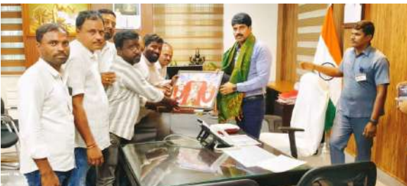
తలకొండపల్లి, ఏప్రిల్ 27 (ప్రజాజ్యోతి): రంగారెడ్డి జిల్లా తలకొండపల్లి మండల పరిధిలోని జాలపల్లి గ్రామంలో రేషన్ డీలర్ పాల్పడుతున్న అక్రమాలపై గ్రామస్థులు తీవ్ర