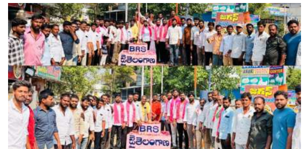
కొత్తూర్ ఏప్రిల్ 27 (ప్రజాజ్యోతి) తెలంగాణ ఆవిర్భావ దినోత్సవాన్ని పురస్కరించుకుని నందిగామ మండల పరిధిలోని చేగూర్ గ్రామంలో బీఆర్ఎస్ పార్టీ ఆధ్వర్యంలో