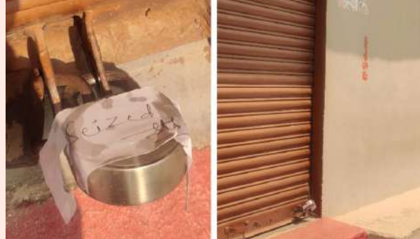
లైసెన్స్ వెంటనే రద్దు చేయాలని, ఆ స్థానంలో గ్రామంలోని నిరుద్యోగ యువతకు రేషన్ డీలర్ షిప్ ఇచ్చి ఉపాధి కల్పించాలని గ్రామస్థులు అధికారులను కోరారు.

తలకొండపల్లి, ఏప్రిల్ 25 (ప్రజా జ్యోతి): తలకొండపల్లి మండల పరిధిలోని జూలపల్లి గ్రామంలో అక్రమంగా 20.50 క్వీంటాల రేషన్ బియ్యం తరలిస్తున్న ఇద్దరు వ్యక్తులపై ఇటీవల గురువారం కేసు నమోదు అయింది. పేద ప్రజలకు ఉచితంగా పంపిణీ చేస్తున్న రేషన్ బియ్యాన్ని తప్పుదోవ పట్టించే రేషన్ డీలర్ వారి చౌకధర దుకాణాన్ని సీజ్ చేసినట్లు అధికారులు చెప్పారు. ఏళ్ల తరబడి జరుగుతున్న అక్రమ రవాణాకు అడ్డుకట్ట వేసిన గ్రామస్థులు రేషన్ డీలర్ షిప్ ను రద్దు చేసి, స్థానిక నిరుద్యోగ యువతకు అవకాశం కల్పించాలని గ్రామస్థులు కోరుతున్నారు. ఇటీవల గురువారం ఆర్.ఐ. శ్రావణ్ కుమార్, జీపీవో నర్సింహా 20.50 క్వీంటాల రేషన్ బియ్యం పట్టుకొని డీలర్ వనంపై 6వ కేసు నమోదు చేసి రేషన్ షాప్ సీజ్ చేసినట్లు వారు తెలిపారు. ఈ విషయం పట్ల గ్రామస్థులు శనివారం ఆనందం వ్యక్తం చేశారు. చాలా కాలంగా జరుగుతున్న ఈ అక్రమ రవాణాకు చెక్ పడటంతో గ్రామస్థులు హర్షం వ్యక్తం చేశారు. సదరు రేషన్ డీలర్