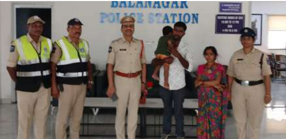
బాలానగర్, ఏప్రిల్ 25 (ప్రజా జ్యోతి) : ఆడుకుంటూ వెళ్లి దారి తప్పిన ఓ రెండేళ్ల చిన్నారుని, పోలీసులు అత్యంత వేగంగా స్పందించి తల్లిదండ్రుల వద్దకు చేర్చారు.

-ఆనందభాష్యాలతో పోలీసులకు కృతజ్ఞతలు తెలిపిన బాలుడి తల్లిదండ్రులు