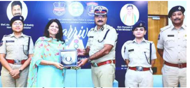
ఒక్కరూ గుర్తుంచుకోవాలని కోరారు. డ్రైవింగ్లో క్రమశిక్షణ పాటించడం ద్వారా ప్రాణనష్టాన్ని గణనీయంగా తగ్గించవచ్చని ఈ సందర్భంగా కమిషనర్ పునరుద్ఘాటించారు. ముఖ్యంగా 18 నుండి 35 ఏళ్ల లోపు యువతే ఎక్కువగా రోడ్డు ప్రమాదాల బారిన పడుతుండటం పట్ల సీపీ ఆవేదన వ్యక్తం చేశారు. యువత దేశానికి వెన్నెముక అని, వారు తమ బాధ్యతను గుర్తించి డి ఫెన్సివ్ డ్రైవింగ్ పద్ధతులను అలవాటు చేసుకోవాలని సూచించారు. రోడ్డుపై వెళ్లేటప్పుడు కేవలం మన ప్రయాణం గురించే కాకుండా, ఇతర వాహనదారుల భద్రతను కూడా దృష్టిలో ఉంచుకోవాలని కోరారు. కాలేజీ విద్యార్థుల్లో మార్పు తీసుకురావడానికి ప్రత్యేక శిక్షణా తరగతులు నిర్వహిస్తున్నామని, యువత తమ ప్రాణాలను పణంగా పెట్టి మితిమీరిన వేగంతో వాహనాలు నడపకూడదని ఆయన హితవు పలికారు. ఎన్ ఫోర్స్ మెంట్ చర్యల్లో భాగంగా సైబరాబాద్ పోలీసులు ఆపరేషన్ రోప్ ను కఠినంగా అమలు చేస్తున్నట్లు అధికారులు తెలిపారు. ఫుట్ పాత్ లపై ఉన్న అక్రమ ఆక్రమణలను తొలగించడం ద్వారా పాదచారులకు సురక్షితమైన మార్గాన్ని ఏర్పాటు చేస్తున్నామని, దీనివల్ల ట్రాఫిక్ ఇబ్బందులు కూడా తగ్గుతాయని వివరించారు. వాహనదారులు లేనే క్రమశిక్షణ పాటించాలని, రాల్ డ్రైవింగ్ లైట్ల వాడకంపై అవగాహన కలిగి ఉండాలని కోరారు. కొత్తగా డ్రైవింగ్ లైసెన్స్ పొందే వారికి స్వచ్ఛంద సంస్థల సహకారంతో ప్రత్యేక శిక్షణ ఇవ్వనున్నామని, ప్రజల భాగస్వామ్యంతోనే సైబరాబాద్ రోడ్డు ప్రమాద రహితంగా మార్చగమని పోలీసులు ఈ సందర్భంగా స్పష్టం చేశారు.