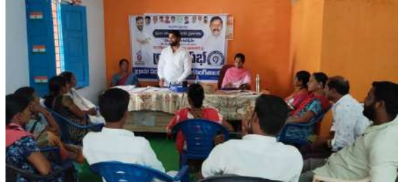
కుల్చవర్ష మండలం ఏప్రిల్ 24 (ప్రజా జ్యోతి) కుల్చవర్ష మండల పరిధిలోని లాలే సింగ్ తండా గ్రామపంచాయతీలో జాతీయ పంచాయతీరాజ్ దినోత్సవం