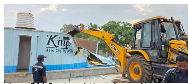
రాజేంద్రనగర్, ఏప్రిల్ 22 (ప్రజా జ్యోతి) 100 కోట్ల విలువ చేసే ప్రభుత్వ భూమిని హైద్రా అధికారులు కాపాడిన ఘటన శంషాబాద్ లోని ఎయిర్పోర్ట్ కాలనీలో చోటుచేసుకుంది. వివరాలకు వెళ్ళితే రంగారెడ్డి జిల్లా శంషాబాద్ మండలం ఏర్పాటు కాలనీలోని సర్వేనెంబర్ 626/2 లోని 9 ఎకరాల 05 గుంటల ప్రభుత్వ భూమిలో కొందరు

100కోట్ల ప్రభుత్వ భూమిని కాపాడిన హైద్రా భారీ పోలీసు బందోబస్తు మధ్య ప్రహారీ గోడ, షెడ్లు కూల్చివేత ఫెన్సింగ్, బోర్డు ఏర్పాటు హైద్రా అధికారులు