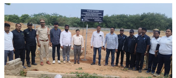
రియల్ ఎస్టేట్ వ్యాపారులు అక్రమార్కులు అక్రమించి వెంచర్ చేయడాన్ని సవాలు స్థానికులు రెవెన్యూ అధికారులతో పాటు హైద్రా అధికారులకు ఫిర్యాదు చేయడంతో బుధవారం హైద్రా కమిషనర్ రంగనాథ్ అదేశాలతో హైద్రా అధికారులు భారీ పోలీసు బందోబస్తు మధ్య దాదాపు 100 కోట్ల విలువ చేసే ప్రభుత్వ భూమిని కాపాడారు. ప్రభుత్వ భూమిలో రియల్ ఎస్టేట్ వ్యాపారులు అక్రమంగా వెంచర్ చేస్తూ రోడ్డు ప్రహారీ గోడ నిర్మించారని, గమనించి వాటిని పూర్తిగా పోలీసు బందోబస్తు మధ్య జెసిబి లతో పూర్తిగా నీలమట్టం చేశారు. ప్రభుత్వ భూమిని అక్రమించి వెంచర్ చేసిన అక్రమార్కులపై కఠిన చర్యలు తీసుకొని స్థానికులు డిమాండ్ చేశారు. ప్రభుత్వ భూమిని హైద్రా అధికారులు కాపాడడంతో స్థానికులు హర్షం వ్యక్తం చేశారు.