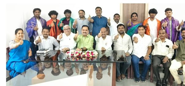
గర్వపడుతున్నామని యాజమాన్యం వెల్లడించింది. ఈ సందర్భంగా కాలేజీ చైర్మన్ మరియు డైరెక్టర్ మాట్లాడుతూ... జేఈఈ మెయిన్స్ లో మా విద్యార్థులు సాధించిన ఈ విజయం పట్ల మేము గర్వపడుతున్నాము, విద్యార్థుల కఠోర శ్రమ, అధ్యాపకుల అంకితభావం, వినూత్నబోధనా పద్ధతులే ఈ అఖండ విజయానికి పునాది అని కొనియాడారు. విద్యార్థులకు అకాడమిక్ తో పాటు వారి పై పత్తిడిలేకుండా పోటీ పరీక్షలకు సిద్ధం చేయడంలో ఎస్ ఆర్ విద్యా సంస్థ ఎప్పుడూ ముందుంటుందని మరొకసారి నిరూపించబడిందని పేర్కొన్నారు. జేఈఈ అడ్వాన్స్ లో కూడా మా విద్యార్థులు ఇదే ఉత్సాహాన్ని ప్రతిభను కనబరుస్తారని ఆశిస్తున్నాం అని తెలిపారు. ఈ విజయాన్ని సాధించిన విద్యార్థులను, సహకరించిన తల్లిదండ్రులను, అధ్యాపక బృందాన్ని కాలేజీ యాజమాన్యం ప్రత్యేకంగా అభినందించింది. విద్యార్థుల బంగారు భవిష్యత్ కి ఎస్ ఆర్ విద్యా సంస్థ కేరాఫ్ గా నిలుస్తుందన్నారు.