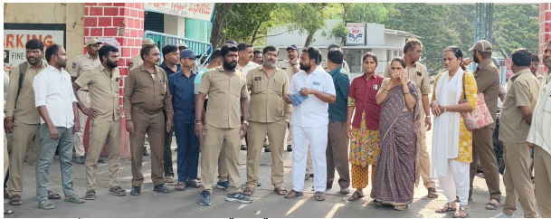
ఇచ్చినప్పటికీ ఇప్పటివరకు అమలు చేయలేదని యూనియన్ నాయకులు విమర్శించారు. ఈ అంశంపై పలుమార్లు అధికారులతో చర్చలు జరిగినప్పటికీ ఫలితం లేకపోవడంతో 45 రోజుల ముందే సమ్మె నోటీసు ఇచ్చి ఉద్యమానికి దిగినట్లు తెలిపారు. ఇప్పటికైనా ప్రభుత్వం స్పందించి ఆర్టీసీ కార్మికుల సమస్యలను తక్షణమే పరిష్కరించాలని వారు డిమాండ్ చేశారు. ఈ కార్యక్రమంలో యూనియన్ నాయకులు, డ్రైవర్లు, కండక్టర్లు తదితరులు పాల్గొన్నారు.

బోయిస్ పల్లి, ఏప్రిల్ 22 (ప్రజా జ్యోతి): ఆర్టీసీ కార్మికుల సమ్మె నేపథ్యంలో జూబ్లీ బస్ స్టేషన్ వద్ద బస్సులు డిపోలకే పరిమితమయ్యాయి. బుధవారం మేడ్చల్, కంట్లవోంట్, పికెట్, రాణిగంజ్, సికింద్రాబాద్ ప్రాంతాల డిపోలలో ఆర్టీసీ బస్సులు ఎక్కడిక్కడై నిలిచిపోయాయి. ఉత్తర తెలంగాణ ప్రాంతాలకు వెళ్ళాల్సిన బస్సు సర్వీసులు పూర్తిగా నిలిచిపోవడంతో ప్రయాణికులు తీవ్ర ఇబ్బందులు ఎదుర్కొన్నారు. ముఖ్యంగా అత్యవసర ప్రయాణాల కోసం వచ్చిన వారు ప్రత్యామ్నాయ మార్గాలు అన్వేషించాల్సిన పరిస్థితి ఏర్పడింది. ఈ సందర్భంగా ఆర్టీసీ యూనియన్ నాయకులు మాట్లాడుతూ, ఆర్టీసీని ప్రభుత్వంలో విలీనం చేయాలని, రెండు పీఆర్డీలను తక్షణమే అమలు చేయాలని డిమాండ్ చేశారు. మహాల్క్ష్మీపథకం విజయవంతం కావడానికి ఆర్టీసీ కార్మికులే ప్రధాన కారణమని, ఈ విషయాన్ని ముఖ్యమంత్రి రేవంత్ రెడ్డి గుర్తించాలని కోరారు. గతంలో కాంగ్రెస్ పార్టీ ఎన్నికల మేనిఫెస్టోలో ఆర్టీసీ విలీనంతో పాటు ఉద్యోగులకు పీఆర్డీలు ఇస్తామని హామీ