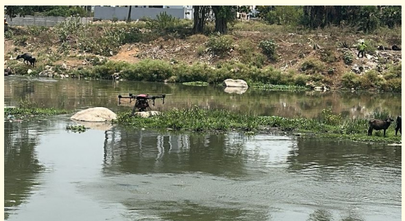
ఉప్పల్ ఏప్రిల్ 22 ప్రజా జ్యోతి ఉప్పల్ జోన్ పరిధిలోని భగాయత్ ప్రాంతంలో దోమల నివారణకు ప్రత్యేక చర్యలు చేపట్టాలని జోనల్ కమిషనర్ ఉప్పల్ రాధికా గుప్తా ఐఎస్ ఆదేశించారు. మూసి నాలా పరిసర ప్రాంతాల్లో దోమల పెరుగుదలను పూర్తిగా అరికట్టేందుకు సమగ్ర చర్యలు చేపట్టాలి డోన్ సహాయంతో ప్రతిరోజు ఎం యల్ ఆయల్ స్ప్రేయింగ్ ను నిరంతరం కొనసాగించాలి. అదేవిధంగా, అడల్ట్ దోమలను నిర్మూలించేందుకు ఏసీఎమ్ స్ప్రేయింగ్ భగాయత్ ప్రాంతంలో రోజువారీగా నిర్వహించాలి," అని సూచించారు. "మూసి పరిపాహక ప్రాంతంగా ఉన్న భగాయత్ ఫేస్ -X, ఫేస్ -X-X ప్రాంతాల్లో దోమల బెడద పూర్తిగా తగ్గే వరకు చర్యలు ఆపకుండా కొనసాగించాలి. నీటి నిల్వలు లేకుండా చూసుకోవాలి, కాలువలను శుభ్రంగా ఉంచాలి, పారిశుధ్యంపై ప్రత్యేక దృష్టి పెట్టాలి," అని ఆదేశించారు. అదనంగా, ఫీల్డ్ స్టాయిల్ పర్యవేక్షణను బలోపేతం చేసి, ప్రజలకు ఎలాంటి ఇబ్బందులు కలగకుండా చర్యలు తీసుకోవాలని తెలిపారు. ప్రజలు కూడా తమ పరిసరాలను శుభ్రంగా ఉంచి, ఎక్కడైనా నీటి నిల్వలు ఉంటే వెంటనే అధికారులకు సమాచారం ఇవ్వాలని విజ్ఞప్తి చేశారు.