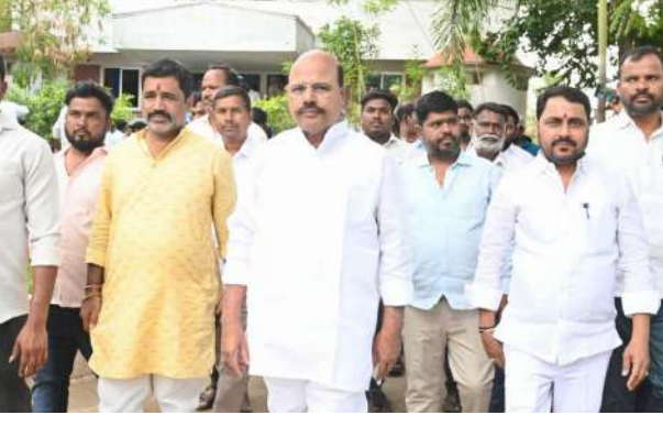
బెయిల్ ఇవ్వడం జరిగిందని సీఐ తెలిపారు. షరతులు... ప్రతి బుధవారం ఉదయం 9 నుంచి సాయంత్రం ఐదు లోపు ఇబ్రహీంపట్నం పోలీస్ స్టేషన్ లో హాజరై సంతకాలు చేయాల్సిందిగా, ఇలా ఎనిమిది బుధవారాలు హాజరు రావాల్సి ఉంటుందని తెలిపారు. తదుపరి కోర్టు ఆదేశాలను అనుసరించాల్సి ఉంటుంది అని ఆయన సూచించారు.