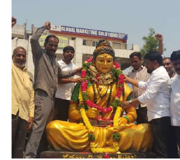
ఎల్వీనగర్ ( ప్రజా జ్యోతి) ప్రతినిధి: ఎల్వీనగర్ చౌరస్తాలో మనసూరాబాద్ డివిజన్ పరిధిలో కవిత్ర మొల్ల విగ్రహ ఆవిష్కరణ ఈ యొక్క కార్యక్రమ నిర్వహణ, బొద్దు పెళ్లి