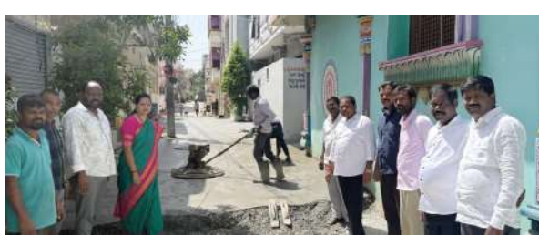
ఉప్పల్ ఏప్రిల్ 9 ప్రజా జ్యోతి బీరప్పగడ్డ డివిజన్ లో తేనె లక్ష్మీనరసింహ అలయం పక్కన వీధిలో సత్యనారాయణ కిరాణా షాప్ పక్కన వీధిలో 27 లక్షల వ్యయంతో నిర్మిస్తున్న

- కార్పొరేటర్లు అభినందించిన బస్తీ వాసులు