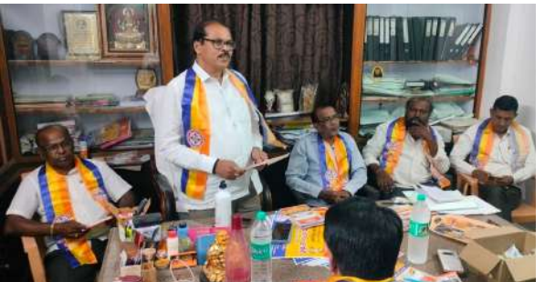
చేవెళ్ల ఏప్రిల్ 09(ప్రజా జ్యోతి): నేటి పోటీ ప్రపంచంలో కేవలం డిగ్రీ సరిపోదు...

- ప్రథమ్ ఎడ్యుకేషన్ ఫౌండేషన్ హెడ్ డిప్యూటీ సీనియర్ కాలేజీ - ప్రభుత్వ డిగ్రీ కళాశాలలో ఉద్యోగ అవకాశాలపై అవగాహన