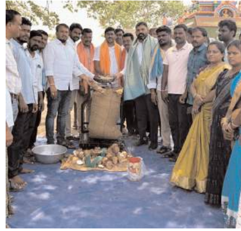
ప్రభుత్వ కొనుగోలు కేంద్రాల్లోనే