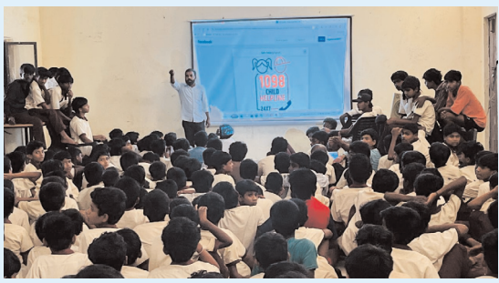
బాలల హక్కులపై అవగాహన కార్యక్రమం