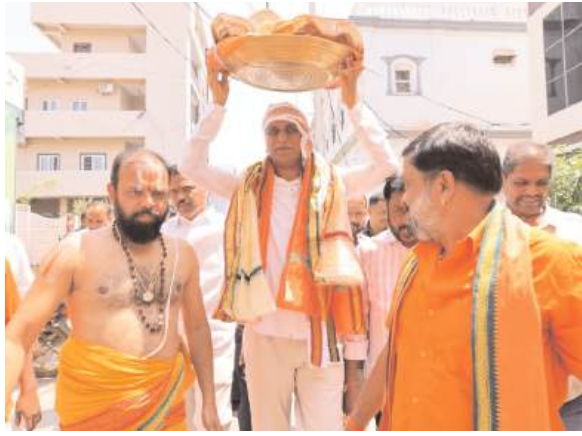
సర్వ జగత్ రక్షకుడు హనుమాన్