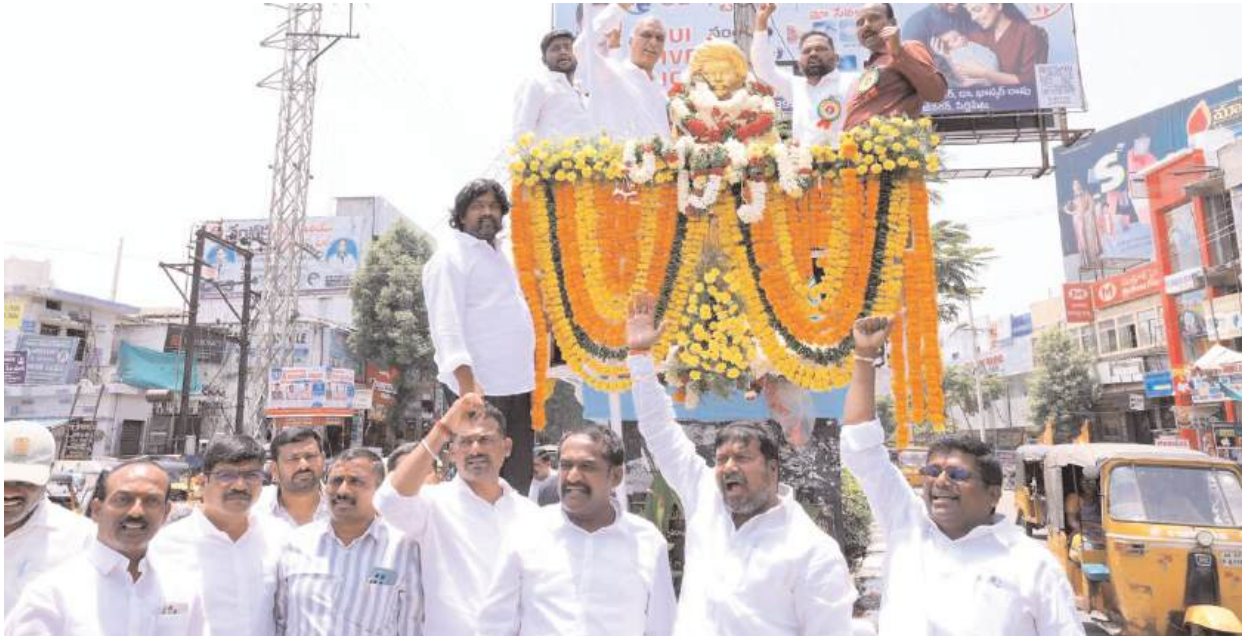
మాజీ మంత్రి, ఎమ్మెల్యే హరీష్ రావు

సిద్దిపేట, ఏప్రిల్ 11, (ప్రజాజ్యోతి): వెనుకబడిన కులాల అభ్యున్నతి కోసం జీవితాంతం పోరాడిన మహనీయుడు, గొప్ప సామాజిక సంస్కర్త మహాత్మ జ్యోతిరావు పూలే జయంతి సందర్భంగా మాజీ మంత్రి, ఎమ్మెల్యే హరీష్ రావు ఘన నివాళులు అర్పించారు. ఈ సందర్భంగా సిద్దిపేట పట్టణంలోని పాత బస్టాండ్ వద్ద ఉన్న మహాత్మ జ్యోతిరావు పూలే విగ్రహానికి పూలమాల వేసి శ్రద్ధాంజలి ఘటించారు. అనంతరం ఆయన మాట్లాడుతూ, సమాజంలో సమానత్వం, విద్యాభివృద్ధి, మహిళా సాధికారత కోసం పూలే చేసిన కృషి