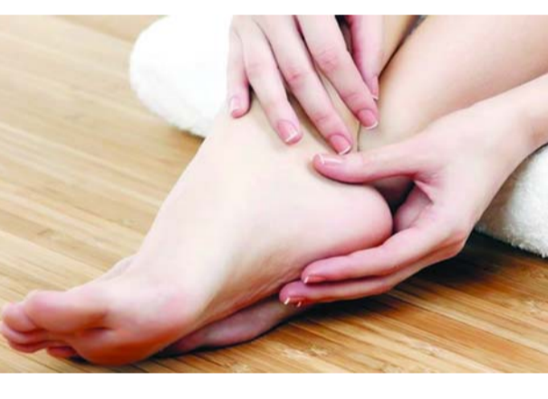
ఎండల ఉధృతి పెరుగుతోంది. ఉక్కుపోతా ఎక్కువైంది. ఈ కాలంలో చెప్పులపై మరింత జాగ్రత్త పడుతుంటారు. అయితే వేసవిలో ఫుట్వేర్తో పాటు ఫుట్కేర్ విషయంలో కూడా జాగ్రత్త పాటించాలి. ఎందుకంటే ఈ కాలంలో వేడి, చెమట, ఎండ వంటి అనేక కారణాలతో పాదాలు పొడిగా, పగిలిపోయి, సన్బర్న్ గురయ్యే ప్రమాదముంది. ఈ సమస్యలను పరిష్కరించుకోవడానికి, పాదాలను ఆరోగ్యంగా ఉంచుకోవడానికి కొన్ని సింపుల్ టిప్స్ పాటిస్తే సరిపోతుంది. అవేంటో తెలుసుకుందాం. స్రుబ్లింగ్ పల్ల చనిపోయిన చర్మ కణాలు తొలగి, రక్తప్రసరణ మెరుగువుతుంది. ఇందుకు ఇంట్లో తయారుచేసిన ఫుట్ స్రుబ్స్ను ఉపయోగించవచ్చు. చక్కెర లేదా కాఫీ పొడిని ఉపయోగించి స్రుబ్ తయారు చేయవచ్చు. మదమలు, పాదాలకు రెండు వైపులా చర్మం త్వరగా పొడిగా, నలుపు రంగులోకి మారుతుంది. అందుకే ఆ ప్రాంతాలపై ద్రుష్టి పెట్టాలి. మాయిశ్చరెజర్స్ తో స్రుబ్ చేసిన తర్వాత, చర్మాన్ని తేమగా, మృదువుగా ఉంచడానికి మాయిశ్చరెజర్ లేదా ఫుట్ క్రీమ్ అప్లై చేసుకోవాలి. తేమను లాక్ చేయడానికి, పొడి చర్మాన్ని పదిలంచుకోవడానికి కొబ్బరి నూనె లేదా గ్లిజిరీన్ వంటి పదార్థాలు రాసుకోవచ్చు. బదులుకు వెజ్ట్ ముందు హానికరమైన ఖా కిరణాల నుంచి రక్షించడానికి కాళ్లకు, పాదాలకు సన్స్క్రీమ్ అప్లై చేయవచ్చు. వేసవి కాలంలో చల్లటి నీటిలో కొన్ని చుక్కల ఫుడినా లేదా టీ ఆయిల్ను కలిపి కాళ్లను కాసిపు అందులో నానబెట్టడం మంచిది. ఇలా చేస్తే ఇన్ఫ్లేమేషన్ ను తగ్గించవచ్చు. ఎప్పుడు సాల్ట్ బ్యామ్ ను సాల్ట్ ను గోరువెచ్చని నీటిలో కలిపి 15-20 నిమిషాల పాటు కాళ్లను నానబెట్టాలి. ఇలా చేస్తే అలసిపోయిన కండరాలు రిలాక్స్ అవుతాయి. ఇన్ఫ్లేమేషన్ కూడా తగ్గుతుంది.