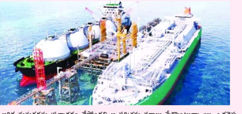
ఆర్థిక మునుగడను ప్రశ్నార్థకం చేస్తోంది ఆ పరిశ్రమ వర్గాలు పేర్కొంటున్నాయి. ఒకవైపు అంతర్జాతీయంగా ధరల అస్థిరత కొనసాగుతుండగా మరోవైపు దేశీయ గ్యాస్ ఉత్పత్తి కూడా సుమారు 5 శాతం మేర తగ్గడం పరిస్థితిని మరింత క్లిష్టతరం చేసింది. పశ్చిమ ఆసియాలో యుద్ధ ఘర్షణలు త్వరగా తొలగకపోతే ఇంధన భద్రత విషయంలో భారత్ మరిన్ని సవాళ్లను ఎదుర్కోవాల్సి ఉంటుందని, దీని ప్రభావం పరోక్షంగా విద్యుత్, నిత్యావసర వస్తువుల ధరలపై పడే అవకాశం ఉందని ఆర్థిక నిపుణులు హెచ్చరిస్తున్నారు.

న్యూఢిల్లీ : భారతదేశం తన ఇంధన అవసరాల కోసం భారీ పెట్టుబడులతో నిర్మించిన లిక్విడ్ నేషనల్ గ్యాస్ (ఎల్ఎన్జి) టెర్మినల్స్ ప్రస్తుతం తీవ్ర సంక్షోభాన్ని ఎదుర్కొంటున్నాయి. పశ్చిమ ఆసియాలో నెలకొన్న యుద్ధ ఉద్రిక్తతలు సరఫరా వ్యవస్థను దెబ్బతీయడంతో దేశంలోని కీలక ఎల్ఎన్జి టెర్మినల్స్ వాటి పూర్తి సామర్థ్యంలో సగం కూడా వినియోగంలో లేవని తాజా గణాంకాలు వెల్లడిస్తున్నాయి. ముఖ్యంగా ఇరాన్ యుద్ధం కారణంగా అంతర్జాతీయ మార్కెట్లో గ్యాస్ ధరలు ఆకాశాన్ని తాకడం, రవాణా మార్గాల్లో అటంకాలు ఏర్పడటం ఈ పరిస్థితికి ప్రధాన కారణాలుగా మారాయి. గత కొన్నేళ్లుగా భారత్ తన గ్యాస్ అవసరాల కోసం దిగుమతులపై ఆధారపడటం పెరిగింది. ప్రస్తుత సరఫరా షాక్ కారణంగా మార్చి నెలలో ఎల్ఎన్జి దిగుమతులు గణనీయంగా తగ్గి 1.6 మిలియన్ టన్నులకు పరిమితమయ్యాయి. దేశంలోనే అతిపెద్దదైన దహేజ్ టెర్మినల్ తన సామర్థ్యాన్ని పెంచుకున్నప్పటికీ, దాని వినియోగం ప్రస్తుతం కేవలం 56 శాతానికి పడిపోయింది. అంతర్జాతీయంగా గ్యాస్ ధరలు ప్రతి ఎంఎంబిటియూ 20 డాలర్లకు పైగా పెరగడంతో దేశీయంగా ఎరువులు, విద్యుత్, ఇతర పారిశ్రామిక రంగాలు గ్యాస్ వాడకాన్ని తగ్గించుకోవాల్సి వస్తోంది. ఈ పరిణామం భారీ వ్యయంతో నిర్మించిన ఎల్ఎన్జి ప్రాజెక్టుల