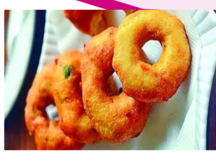
పండుగలు, ప్రత్యేక రోజు ఏదైనా ఉండంటే.. చాలా మంది పిండివంటల్ని చేసుకుని తింటారు. కొన్నిసార్లు మామూలుగా కూడా ఇంట్లో ఫూరి, వడ వంటివి చేస్తుంటారు. పిల్లలు ఇష్టంగా తింటారని ఇళ్లలో వడలు, ఫూరి, గారెలు తరచూగా డ్రైఫ్రాస్ట్, స్నాక్స్ గా కూడా చేస్తుంటారు. అయితే, ఫూరి, వడ, గారెలు వంటివి చేసేటప్పుడు వాటిని ఎక్కువ అయిల్లో కాల్చాల్సి వస్తుంది. అప్పుడు ఆ వంటకం నూనె ఎక్కువగా పీల్చుకుండా ఉండేందుకు కొన్ని ఉపాయాలు ఉన్నాయి. వాటితో ఎక్కువ నూనెతో ఇబ్బంది లేకుండా మీ వంటకాలు అయిల్ ను లైట్ గా పీల్చుకునే చేసుకోవచ్చు. అలాంటి టిప్స్ ఏంటో ఇక్కడ తెలుసుకుందాం.. ఇంట్లో వడలు చేయాలనుకున్నప్పుడు సహజంగానే అవి మొత్తగా ఉండాలని పిండిని మెత్తగా రుబ్బుకుంటారు. కానీ, దీని వల్ల నూనె ఎక్కువగా పీల్చుకుంటాయి. అలా కాకుండా పిండిని నార్మల్ గా పిండియం రెంజ్ లో రుబ్బుకోవాలి. అలాగే, ఇక వడలు చేసేప్పుడు నూనె బాగా వేడికిస్తే తర్వాత వడలు, గారెలు వేసి కాల్చుకోవాలి. తక్కువ వేడిగా ఉన్నప్పుడు వేస్తే అవి నూనెని ఎక్కువగా పీల్చుకుంటాయి. అలా అని మంటను ఎప్పుడు తక్కువ ఫ్లేమ్లో పెట్టుకోవడం కూడా చెయ్యొద్దు. ఎక్కువ మంటపెట్టి వడల్ని వేయించుకోవాలి. అయితే, నూనెని మరీ ఎక్కువగా వేడి చేయొద్దు. పిండియం కంటే వేడిగా ఉండాలి. మరీ ఎక్కువ వేడి అయితే గారెలు పై పై నూనె పోతాయి. లోపల పచ్చిగానే ఉంటాయి. అలాగే, గారెలు కరకరలాడుతూ ఉండాలంటే గారెల పిండిలో కొంచెం సేమ్మ కలపాలి. దాంతో పాటు గారెల పిండి మిక్సీ చేసిన 5 నిమిషాల లోపే గారెలను వేసుకుంటే నూనె పీల్చు. గారెలు, వడలు, నూనెలో ప్రై చేసిన ఏ పదార్థాలైనా అలానే తినకూడదు. వాటిని కాల్చుకున్న తర్వాత టిప్స్, బటర్ సేపర్, కిచెన్ టవల్ లో వేయాలి. అప్పుడే అందులోని నూనె తగ్గుతుంది. దీంతో ఎక్సెస్ అయిల్ ఆ ఫ్రై పేపర్ పీల్చుకుంటాయి. ఈ చిట్కాలు ఫ్రైలో అయితే ఎటువంటి భయం లేకుండా హ్యాపీగా తినవచ్చు.