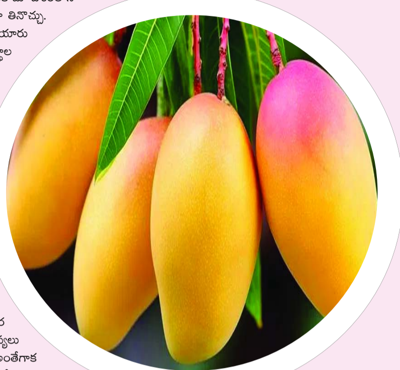
వేసవి ఆగమంతోనే మార్కెట్లోకి మామిడి పండ్ల రాక మొదలవుతుంది. మన దేశం మామిడి పండ్లకు ఎంతో ప్రసిద్ధి. ప్రపంచంలో మరెక్కడా లభించనన్ని రకాల మామిడి పండ్లు భారత్ లో లభిస్తాయి. అంతేకాదు దేశంలోని మామిడిపండ్ల రకరకాల రుచుల్లో అందుబాటులో ఉంటాయి. ఈ మామిడి పండ్లను నేరుగా తినొచ్చు. జ్యూస్లుగా చేసుకుని తాగవచ్చు. మామిడి తాండ్ల, మామిడి కర్రలా లాంటి పదార్థాలు తయారు చేసుకుని కూడా తినొచ్చు. అయితే ఈ మామిడిపండ్లు తిన్న తర్వాత ఓ ఐదు రకాల పదార్థాల జోలికి అస్సలు పోవద్దు. ఆ పదార్థాలేమిటో ఇప్పుడు చూద్దాం.. మంచి నీళ్లు : మామిడి పండ్లు తిన్న తర్వాత కొంతసేపటి వరకు మంచినీళ్లను అస్సలు తాగొద్దు. అలా చేస్తే ఆరోగ్యంపై దుష్ప్రభావం పడుతుంది. కడవు నొప్పి, అసిడిటీ, కడుపు ఉబ్బరం లాంటి సమస్యలు వచ్చే అవకాశం ఉన్నదట. పెరుగు : మామిడి పండు తినగానే పెరుగు తీసుకుంటే శరీరం డిప్రెస్డ్రేట్ అవుతుంది. అందువల్ల అలాంటి అలవాటు ఉంటే తక్షణమే మానుకోవాలి. లేదంటే వడదెబ్బ తగితే ప్రమాదం ఉంది. అంతేగాక చర్మ సమస్యలు కూడా వచ్చే అవకాశం ఉన్నదట. కాకరకాయ : మామిడి పండ్లు తిన్న తర్వాత కాకరకాయ తీసుకోవడం కూడా మంచిది కాదు. అలా చేయడంవల్ల వికారం, వాంతులు, శ్వాస తీసుకోవడంలో సమస్యలు వస్తాయట. ఘాటైన పదార్థాలు : మామిడి పండ్లు తిన్న తర్వాత ఘాట పదార్థాలుగానీ, కారం పదార్థాలుగానీ తీసుకుంటే ఉదర సంబంధ సమస్యలు, చర్మ సమస్యలు వచ్చే అవకాశం ఉన్నదట. అంతేగాక ముఖంపై మొటిమలు వచ్చే ప్రమాదం కూడా ఉన్నదట. చల్లటి పానీయాలు : మామిడి పండ్లతోపాటు చల్లటి పానీయాలు తీసుకోవడం కూడా ఆరోగ్యానికి హానికరమట. చల్లటి పానీయాలతో మామిడి పండ్లను తీసుకోవడంవల్ల షుగర్ లెవల్స్ మరింత పెరుగుతాయట.