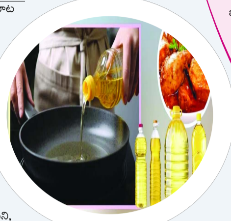
చాలా కూరలు వండటానికి ఉల్లిపాయ, టమాట ముక్కలను నూనెలో వేయిస్తుంటారు. దీంతో వాటికి నూనె బాగా పట్టుకొని అవి ఉడికితే మెయిల్ చేయాల్సి ఉంటుంది. ఇలా నేరుగా కాకుండా వీటిని ముందుగానే పేస్ట్లా తయారు చేసుకుంటే నూనె వాడకం తగ్గించవచ్చు. ఉల్లిపాయ, టమాటా ముక్కలను మిక్సీ పట్టి, కూరలు వండేటప్పుడు నూనెలో వేసుకుంటే త్వరగా వేగుతాయి. దీనికి ఆయిల్ కూడా పెద్దగా అవసరం ఉండదు. కూరలో ఆయిల్ వేయకపోతే అది మాడిపోతుంది. అయితే, కొంచెం ఓపిక పడితే ఇక్కడ కూడా నూనె వినియోగాన్ని తగ్గించవచ్చు. స్టవ్ను మీడియం ఫ్లేమ్లో పెట్టుకుని, కూర ఉడికితే ముందు మధ్యమధ్యలో మాడకుండా కొన్ని నీళ్లు చల్లుతూ ఉండాలి. నీళ్లు పోసినప్పుడు ఒకేసారి కాకుండా నెమ్మదిగా కలపాలి. కూరల్లో వివిధ సుగంధ ద్రవ్యాలు కచ్చితంగా వాడుతుంటారు. జీలకర్ర, ధనియాలు, లవంగం, దాల్చినచెక్క వంటివి నూనెలో వేసినప్పుడు అవి ఎక్కువ నూనెను గ్రహిస్తాయి. ఇలా నేరుగా వేయడానికి బదులుగా, ముందుగా వీటిని పొడి చేసుకోవడం లేదా నూనె లేకుండా నేరుగా వేయించుకోవడం మంచిది. డ్రై ఫ్రాన్లో వీటిని వేయిస్తే వాటి అసలు ఫ్లేవర్స్ రిలీజ్ అవుతాయి. వీటిని పొడిగా చేసుకున్నాకే కూర వండేటప్పుడు పొదులు వేసుకోవచ్చు. దీంతో తక్కువ నూనెను గ్రహిస్తాయి. పైగా, ఇవి వంటకు మరింత రుచిని అందిస్తాయి. గ్రేవీలా చేసే కూరలకు చిక్కదనం కోసం ఉడికించిన పప్పు, గుమ్మడికాయ గుజ్జు, తురిమిన సొరకాయ గుజ్జు వాడాలి. ఇవి కొవ్వు శాతాన్ని తగ్గించి వంటకు స్వాదీయత రిలీజ్ అందిస్తాయి. పైగా గ్రేవీ చిక్కగా వస్తుంది, ఇందుకు నూనె కూడా పెద్దగా వాడాలి అవసరం లేదు. ఈ నేచురల్ ఎడిటివ్స్ తో ఫైబర్, విటమిన్లు అందడంతో పాటు కడుపు నిండిన అనుభూతి కలుగుతుంది. చాలా మంది కూర వండక దానిపై ఒక చెండా నెయ్యి లేదా నూనె పోసి గార్లిష్ చేస్తుంటారు. అయితే ఇలా ఆయిల్ కాకుండా డ్రెస్స్ పార్శుల్స్, నిమ్మరసం, మసాలా పొడితో గార్లిష్డ్ డ్రెస్ చేసి చూడండి. కొత్తమీర, కసూరిమేధి, గరం మసాలా వంటివి వేసుకుంటే నూనె అవసరం లేకుండా వంట ఫ్లేవర్ రిచ్ గా మారుతుంది.