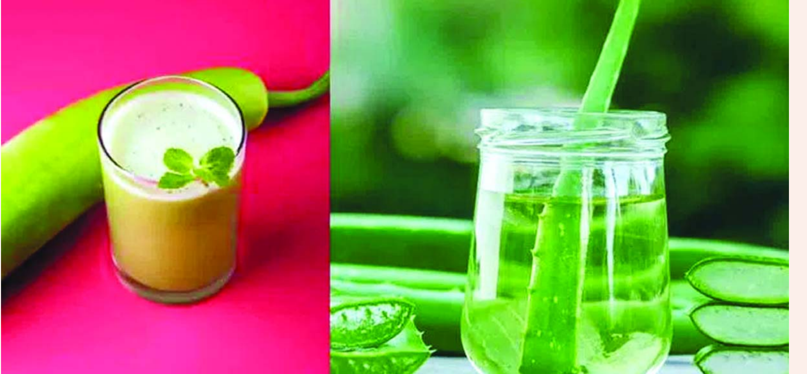
సారకాయ రక్తిస్తూ శాంతింపజేస్తాయి.

అలోవెరా జ్యూస్ లో.. అయితే ఒక ముఖ్యమైన జాగ్రత్త తప్పనిసరి. సారకాయ చేదుగా ఉంటే దాని రసం తాగకూడదు. చేదు రుచి క్యూకర్బిటాసిన్ అనే విషపూరిత రసాయనం అధికంగా ఉందని సూచిస్తుంది. ఇది ఫుడ్ పాయిజనింగ్, పొట్టలో పుండ్లు, తీవ్రమైన ఆరోగ్య సమస్యలకు దారితీస్తుంది. కాబట్టి రసం తీయడానికి ముందు చిన్న ముక్కను రుచి చూసి నిర్ధారించుకోవాలి. సారకాయ ఎక్కువ పరిమాణంలో హైడ్రేషన్ అందిస్తే, అలోవెరా పోషకాల నిల్వగా ఉంటుంది. అలోవెరా జ్యూస్ లో 75కు పైగా సక్రియ పదార్థాలు ఉండటం విశేషం. అలోవెరాలో మ్యూకోపాలిశాకరైడ్స్ ఉండటం వల్ల శరీర కణాల్లో తేమను నిల్వ చేస్తాయి. ఇది కేవలం హైడ్రేషన్ ఇవ్వడమే కాకుండా చర్మాన్ని లోపలి నుంచి మృదువుగా, ఎలాస్టిక్‌గా మార్చుతుంది. సూర్య కిరణాల వల్ల చర్మానికి కలిగే నష్టాన్ని తగ్గించడంలో ఇది సహాయపడుతుంది. వేసవి వేడి కారణంగా జీర్ణ సమస్యలు, ఆసిడిటీ పెరిగితే అలోవెరా మంచి పరిష్కారం. ఇందులో ఉండే యాలీ ఇన్‌ఫ్లమేటరీ ఎంజైమ్స్ అన్నవాహిక, జీర్ణాశయ 100 మిల్లీ లీటర్ల సారకాయ జ్యూస్ కు 20 మిల్లీ లీటర్ల