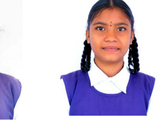
మండలంలోని అన్ని పాఠశాలలు 95.48% శాతము సాధించడం జరిగిందన్నారు. ఉత్తీర్ణత చెందిన, ప్రతిభ కనపరిచిన విద్యార్థినిలకు ప్రధానోపాధ్యాయుల తో పాటు ఉపాధ్యాయులు, తల్లిదండ్రులు, పాఠశాల ఆయన ఆభినందనలు తెలియజేశారు.