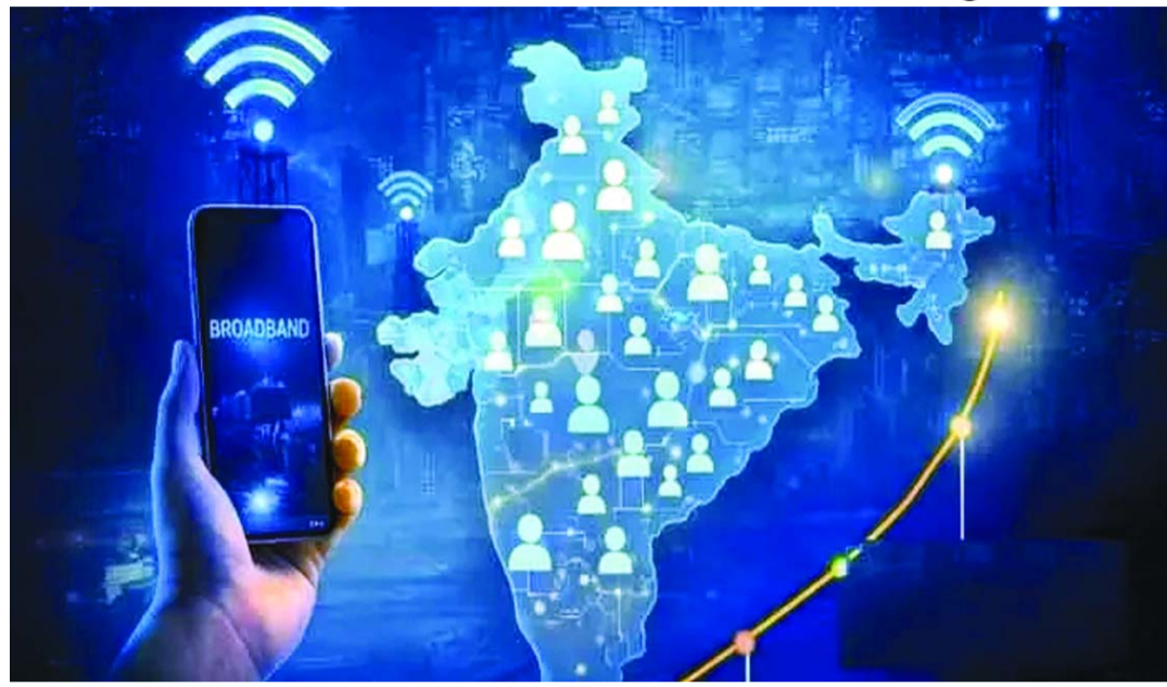
కూడా వేగంగా సాగుతోంది. ఫిబ్రవరి నెలలో ఏకంగా 14.47 మిలియన్ల మంది మొత్తం నెట్వర్క్లో చేరారు. గ్రామాణ ప్రాంతాల్లో కూడా కనెక్టివిటీ పెరుగుతుండటం టెలికాం రంగ విస్తరణకు నిదర్శనంగా కనిపిస్తుంది.

భారతదేశ టెలికాం రంగం పరుగులు కొనసాగుతూనే ఉన్నాయి. ట్రాయ్ నివేదిక ప్రకారం.. ఫిబ్రవరి 2026 చివరి నాటికి దేశంలోని మొత్తం టెలిఫోన్ వినియోగదారుల సంఖ్య 1,321.31 మిలియన్లకు (132.13 కోట్లు) చేరుకుంది. కేవలం ఫిబ్రవరి నెలలోనే రికార్డు స్థాయిలో 7.31 మిలియన్ల కొత్త చందాదారులు నెట్వర్క్లో చేరారు. బ్రాడ్బ్యాండ్ విభాగంలో చోటుచేసుకున్న భారీ వృద్ధి ఈ విజయానికి ప్రధాన కారణంగా నిలిచినట్లు తెలుస్తుంది. దేశంలో బ్రాడ్బ్యాండ్ వినియోగదారుల సంఖ్య జనవరిలో 1,052.72 మిలియన్లు ఉండగా, ఫిబ్రవరి నాటికి అది 1,059.05 మిలియన్లకు పెరిగినట్లు సమాచారం. బ్రాడ్బ్యాండ్ మార్కెట్లో లిలయన్స్ జియో 519.64 మిలియన్ల చందాదారులతో తన అగ్రస్థానాన్ని సుస్థిరం చేసుకున్నట్లు ట్రాయ్ నివేదిక స్పష్టం చేసింది. దీని తర్వాత భారతీ ఎయిర్టెల్ 364.14 మిలియన్లతో రెండో స్థానంలో ఉండగా, వాడాఫోన్ ఐడియా (129.36 మిలియన్లు), టీఎస్ఎస్ఎల్ (28.70 మిలియన్లు) తర్వాతి స్థానాల్లో ఉన్నాయి. ఇక వెర్వీ బ్రాడ్బ్యాండ్ విభాగంలో కూడా జియో (14.10 మిలియన్లు), ఎయిర్టెల్ (10.54 మిలియన్లు) అధిపత్యాన్ని ప్రదర్శిస్తున్నాయి. దేశవ్యాప్త టెలి-డెన్సిటీ 92.66 శాతానికి చేరుకోగా, పట్టణ ప్రాంతాల్లో ఇది అత్యధికంగా 142.32 శాతంగా సమాధింది. వినియోగదారులు తమకు సచ్చిన నెట్వర్క్లకు మారే ప్రక్రియ