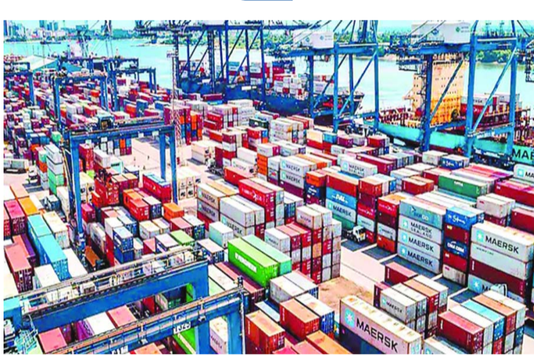
ఉత్పత్తులకు భారత ప్రధాన దిగుమతిదారుగా ఉంది.

అమోనియా, డైక్లోరోమిథేన్, వినైల్ క్లోరైడ్ మోనోమర్, స్టిరీన్, పాలి బ్యుటాడిన్, స్టీరీన్ బ్యుటాడిన్, అన్శాచురేటెడ్ పాలిస్టర్ రెసిన్ వంటి పెట్రో కెమికల్స్ కు దిగుమతి సుంకాన్ని మినహాయించారు. ఈ నిర్ణయంతో ఫ్లాస్టిక్, టెక్స్టైల్స్, ఫార్మా, ఆటో, కెమికల్ రంగాలకు లాభం చేకూరనుందని కేంద్రం పేర్కొంది. పశ్చిమాసియాలో యుద్ధం కారణంగా హరూజ్ మారుగా సరకు రవాణాకు అంతరాయం ఏర్పడిన సంగతి తెలిసిందే. దీంతో ముడిపదార్థం, గ్యాస్, ఎరువులు, ఇతర రసాయనాల దిగుమతులపై ఆందోళనలు నెలకొన్నాయి. ఫెర్టిలైజర్స్, పెట్రోలియం