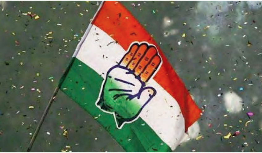
పాలను మరింత చురుకుగా మార్చడం, కొత్త ఉద్దేశ్యాలుగా కనిపిస్తున్నాయి. అలాగే పార్టీ

నాయకత్వం భావిస్తున్నట్లు సమాచారం. ఉత్సాహాన్ని తీసుకురావడం, యువతను గ్రామాలు, మండల స్థాయిలో పార్టీ కార్యకలా ప్రోత్సహించడం ఈ చర్య వెనుక ప్రధాన