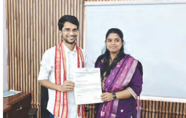
సినిని మెరుగుపరచడానికి ప్రత్యేక చర్యలు తీసుకుంటున్నారని ప్రజా సేవలో ముందుది పనిచేస్తానని ఆమె తెలిపారు.