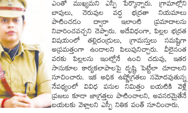
స్పందించడం కంటే ముందస్తు జాగ్రత్తలు తీసుకోవడం ఎంతో ముఖ్యమని ఎస్పీ పేర్కొన్నారు.

కొమరం భీం జిల్లా ప్రజా జ్యోతి క్రైమ్ రిపోర్టర్ ఏప్రిల్ 23 : జిల్లాలో రేపటి నుంచి వేసవి సెలవులు ప్రారంభమవుతున్న సేపట్లంలో పిల్లల భద్రతపై జిల్లా ఎస్పీ నితిక పంత్ ఐపీఎస్ ప్రత్యేకంగా దృష్టి సారించారు.