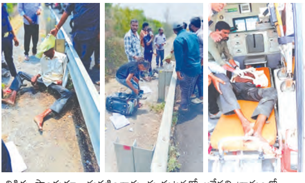
చికిత్స పొందుతూ మరణించారు ఈ ఘటనతో ఆరేపల్లి గ్రామంలో విషాద చాయలు అలముకున్నాయి. కుటుంబ సభ్యులు కన్నీరుమున్నీరవుతున్నారు.

నేరడిగొండ ఏప్రిల్ 23 ప్రజాజ్యోతి : నేరడిగొండ మండలం లోని బుగ్గారం 'బి' హాస్పిట్ నుండి ఆరేపల్లికి వెళ్తుండగా జరిగిన రోడ్డు ప్రమాదంలో ఒకరు ప్రాణాలు కోల్పోయారు.