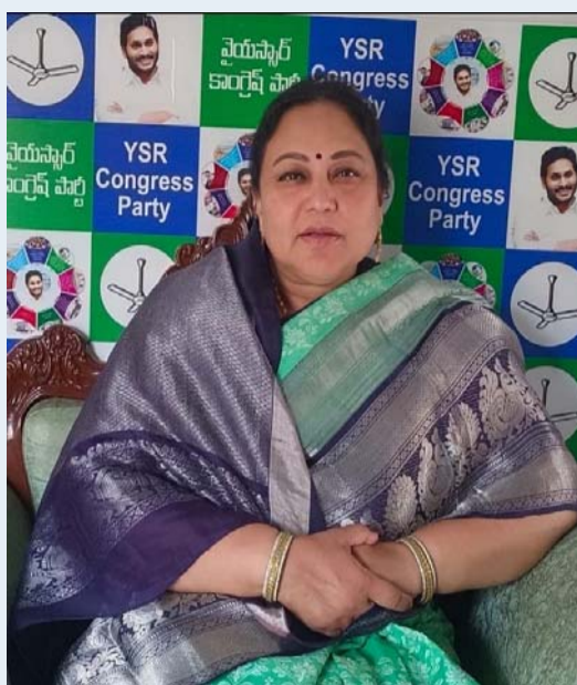
మెడికల్ కళాశాలలు ఏర్పాటుకు కేంద్రం నుంచి అనుమతి పొందామని చెప్పారు. నాడు-నేడు కింద ఆస్పత్రుల అభివృద్ధికి రూ.17 వేల కోట్లు ఖర్చు చేశామని తెలియజేశారు. 2014 నుంచి 2019 వరకు కేవలం 1059 వ్యాధులకు ఆరోగ్యశ్రీ ద్వారా చికిత్స అందించా.. 2019 నుంచి 2024 వరకు 3257 వ్యాధులకు చికిత్స అందించామని తెలిపారు. 2019లో డిడిపీ ప్రభుత్వం రూ.632 కోట్ల బకాయిలు పెట్టి వెళ్లిపోగా తమ ప్రభుత్వం చెల్లించిందని గుర్తు చేశారు. ప్రజారోగ్యాన్ని గాలికి వదిలిసిన ఈ ప్రభుత్వ వైఖరిని ప్రజలు గమనిస్తున్నారని తెలియజేశారు చేశారు.

లోకి రాకముందు 1059 ప్రోసీజర్స్ ఆరోగ్య శ్రీ ఉండేదని.. వైఎస్ఆర్ పీ ప్రభుత్వం అధికారంలోకి వచ్చాక వెయ్యి రూపాయలు చికిత్స ఖర్చు దాటితే ఆరోగ్య శ్రీలోకి తీసుకువచ్చామని గుర్తు చేశారు. ఒకవైపు ప్రజలకు సంపూర్ణ వైద్య భరోసా కల్పించిన వైఎస్ జగన్మోహన్ రెడ్డి గారు మరోవైపు చికిత్స అనంతరం రోగులు కోలుకునే వరకూ ఆ కుటుంబం జీవన భృతి కోసం ఇబ్బంది పడకుండా వైఎస్సార్ ఆరోగ్య ఆసనా ద్వారా ఆదుకున్నారు. వైద్యులు నూచించిన మేరకు నెలకు రూ.5 వేల వరకూ ఆస్పత్రి నుంచి డిస్చార్జ్ అయిన రోజే రోగుల ఖాతాల్లో జమ చేశారు. రోజువారీ కూలీలు, చిరు వ్యాపారుల కుటుంబాల్లో సంపాదించే వ్యక్తి ఆస్పత్రి పాలైతే పోషణ కష్టతరంగా మారుతోందని, దాన్ని దృష్టిలో పెట్టుకుని ఆరోగ్య ఆసనా సాయం కష్ట కాలంలో వారు ఆర్థిక ఇబ్బందులు పాలు కాకుండా ఆదుకుంది. సామాన్యులు ఆసుపత్రికి వెళితే పట్టించుకునే పరిస్థితి లేకుండాపోయిందన్నారు. కూటమి ప్రభుత్వ నిర్లక్ష్యం కారణంగా ప్రజల ఆరోగ్య భద్రతకు ప్రమాదం ఏర్పడిందని ఆందోళన వ్యక్తం చేశారు. సర్కారు ఆసుపత్రుల్లో మందుల కొరత వేధిస్తోందని ఆగ్రహం వ్యక్తం చేశారు. ఉమ్మడి రాష్ట్రంలో వైఎస్ రాజశేఖర్ రెడ్డి పేదల కోసం ప్రవేశపెట్టిన ఆరోగ్యశ్రీ పథకాన్ని నిర్వీర్యం చేసి పేదలకు ఉచితంగా వైద్య సేవలు అందకుండా చేసేందుకు డిడిపీ కూటమి ప్రభుత్వం కుట్ర చేస్తోందని ఆరోపించారు. రాష్ట్ర వ్యాప్తంగా నెట్వర్క్ ఆస్పత్రులకు బిల్లులు చెల్లించకపోవడం వల్ల ఆరోగ్యశ్రీ సేవలు నిలిచిపోయాయని తెలిపారు. ఆరోగ్యశ్రీ పెండింగ్ బిల్లులు వెంటనే చెల్లించాలని కోరారు. ఆరోగ్యశ్రీలో మార్పు ఏ మాత్రమా సరికాదన్నారు. వైసీపీ హయాంలో రాష్ట్రంలో 17