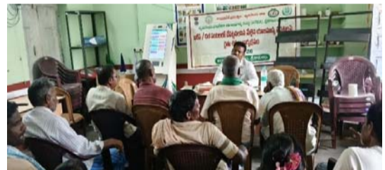
చేసుకున్నట్లుంటే మంచి దిగుబడి సాధించుకోవచ్చు అని తెలియజేశారు అదే విధంగా రాగులు సాగు చేసే రైతులు వెదజల్లు పద్ధతి లేదా గులి రాగి పద్ధతిలో సాగు చేసుకున్నట్లుంటే అత్యధిక దిగుబడులు సాధించుకోవచ్చని తెలియజేశారు. నువ్వులో ఆకు ముడత మరియు కాయతొలుచు పురుగు తొలిదశలో చిన్న గోంగలి పురుగులు రెండు మూడు ఆకులను కలిపి గూడుచేసి లోపలి నుండి ఆకుల్లోని పచ్చని పదార్థాన్ని గోకి తినటం వలన ఆకులు ఎండిపోతాయి. పురుగులు ఎదిగిన కొద్దీ ఎక్కువ ఆకులను కలిపి గూడుగా చేసుకొని ఆకులను తింటాయి. మొగ్గ దశలో

ప్రజా జ్యోతి రిపోర్టర్ :- యం. నరేష్. పాతపట్నం మండలంలోని తిమ్మర గ్రామంలో మండల వ్యవసాయ అధికారి కే సింహాచలం జిల్లా వ్యవసాయ సాంకేతికత యాజమాన్య సంస్థ సాజన్యంతో రబీ మరియు వేసవి పంటలలో పంటలలో చేపట్టవలసిన సాగు పద్ధతులు మీద శిక్షణ కార్యక్రమం నిర్వహించారు ఈ సందర్భంగా రైతులు మొక్కజొన్న పెసర, మినుము రాగులు నువ్వు పంటలలో పాటించవలసిన యాజమాన్య పద్ధతుల గురించి సవివరంగా రైతులకు వివరించారు తదుపరి క్షేత్ర పరిశీలన జరిపి శిబిరాలు మరియు తెగుళ్ల వల్ల ప్రధానంగా కలిగే 50% వరకు నష్టాలను నివారించడానికి మొక్కజొన్న పంట కోతానంతర నిర్వహణ చాలా కీలకం. ముఖ్యమైన చర్యలలో పంట పరిపక్వతకు వచ్చినప్పుడు 30-35% తేమ కోయడం, టార్పాలిన్ పై 12.5--13.5% తేమ వచ్చే వరకు ఆరబెట్టడంచేయాలని తెలియజేశారు. పెసర మినుము బడు శాతం పూత వచ్చు సమయంలో 13 0 45 పాటాషియం నైట్రేట్ ఏడు గ్రాములు లీటర్ నీటికి కలిపి 200 లీటర్ల ద్రావణం పిచికారీ