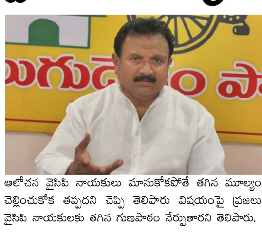
అలోచన వైసిపి నాయకులు మానుకోకపోతే తగిన మూల్యం చెల్లించుకోక తప్పదని చెప్పి తెలిపారు విషయంపై ప్రజలు వైసిపి నాయకులకు తగిన గుణపాఠం నేర్పారాలని తెలిపారు.

కు ఏబీఎన్ మేనేజింగ్ రాధాకృష్ణ గారు భయపడే రకం కాదని చెప్పారు మాజీ ముఖ్యమంత్రి జగన్మోహన్ రెడ్డి తండ్రి గారు వైయస్ రాజశేఖర్ రెడ్డి గారు అప్పట్లో ఆంధ్రజ్యోతి కార్యాలయం పై బుల్డోజర్లు పంపించిన ఏబీఎన్ ఆర్గ్యు గారు వెనక్కి తగ్గలేదు అప్పుడు పంపిన బుల్డోజర్ల వెనక్కి వెళ్ళాయి ప్రజాస్వామ్యంలో ప్రశ్నించే హక్కు మీడియాకు ఉంటుంది మీడియాకు సమాధానం చెప్పే హక్కు మనకు ఉంటుంది అది మరిచి రోడియజంతో గొంతు నొక్కాలని ప్రయత్నిస్తే ఇంకా కఠం గట్టిగా జవాబు ఇస్తుందన్న విషయం వైసిపి నాయకులు తెలుసుకోవాలని హితవు పలికారు జనం ఛీ కొట్టినా కూడా వైసిపి నాయకులు మారడం లేదు ప్రతి విషయంలోనూ అరాచకాలు సృష్టించి ఇంకా భయభ్రాంతులకు గురి చేయాలనే