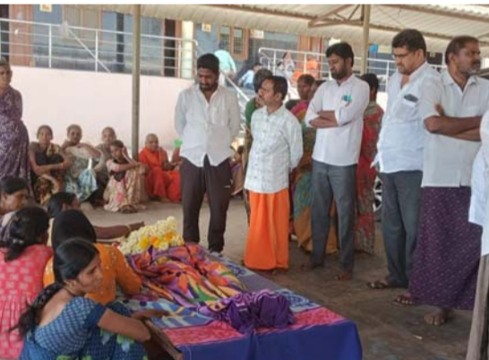
పనిచేస్తున్నవలువురు సిబ్బంది తెలిపారని వారన్నారు, అక్కడ వేలాడుతున్న విద్యుత్ వైర్లు ఏ రకంగా ఎవరికి ఉపయోగంలో లేవని అటువంటి వైర్లను తొలగించకుండా విద్యుత్ పట్ల నిర్లక్ష్యం వ్యవహరించి విద్యార్థి మరణానికి కారణమైన సంబంధిత అధికారిని సస్పెండ్ చేసి శాఖ పరమైన చర్యలు తీసుకోవాలని వారు డిమాండ్ చేశారు. ఆశ్రమం నిర్వాహకులు నరైన పర్యవేక్షణ నిర్వహించడం లేదని భద్రతా చర్యలు కూడాలేవని సోమవారం రాత్రి సమయంలో