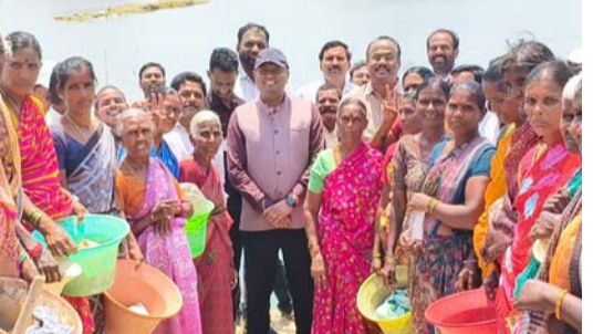
న్ని 100 రోజుల్లో పూర్తి చేసి ప్రతి చెరువుకు మరమ్మత్తులు చేసి సాగు నీరు నింపేలా చర్యలు చేపడుతున్నామన్నారు. రాజోయ్ ఆగస్టు నాటికి అన్ని చెరువులలో పుష్కలంగా నీరు ఉంటేనే రైతు సోదరులు వ్యవసాయం చేసుకునే దానికి అవకాశం కల్పించాలని అధికారులకు సూచించారు. ఇప్పటికే వెలిగెల్లు జలాశయం నీటి ద్వారా రామాపురం, లక్ష్మిరెడ్డి పల్లి, గాలివీడు మండలాల్లో సుమారు 70 చెరువులకు నీటిని నింపి రైతులకు మొహోత్ ఆనందం తీసుకువచ్చామన్నారు. సంబోధించి, చిన్న మండం మండలంలో ఉన్నటువంటి చెరువులకు కూడా నీరు నింపేలా కృషి చేస్తున్నామన్నారు. చిన్న పెద్ద చెరువులు మరమ్మత్తులకు కావలసిన నిధులు కూడా మంజూరు చేయాలని కలెక్టర్ ను ఆయన కోరారు.