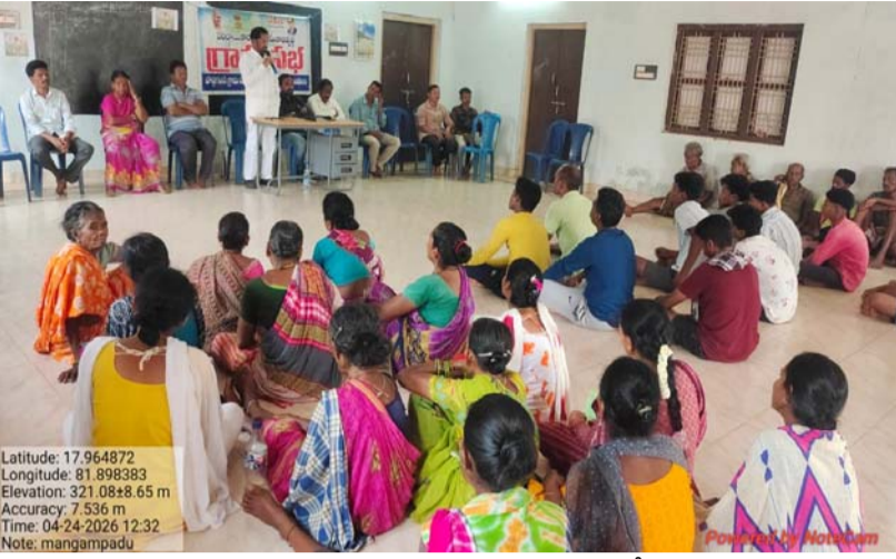
Latitude: 17.964872 Longitude: 81.898383 Elevation: 321.0848.65 m Accuracy: 7.536 m Time: 04-24-2026 12:32 Note: mangampadu