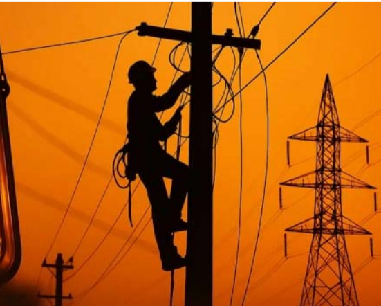
ప్రజలు, రాత్రి వేళలో కాకుండా సాయంకాలం వేళలో కరెంట్ కోతలు విధిస్తే బాగుంటుందని ప్రజలు విద్యుత్ అధికారులను కోరుతున్నారు.

వలయం కాలిపోవడంతో ప్రజలు రెండు రోజులు ఇబ్బందిపడ్డారు. శుక్రవారం రాత్రి 8 నుంచి 9 గంటలకు 11.00 గంటల నుంచి మధ్యలో విద్యుత్ సరఫరాలో అంతరాయం ఏర్పడి ప్రజలు ఉక్కపోతతో నిద్ర రాక అవస్థలు పడుతున్నారు. అప్రకటిత విద్యుత్ కోతపై అధికారులు చేతులెత్తేస్తున్నారు. ప్రధాన సబ్ సుంచే సరఫరా లేదని, అటువంటప్పుడు తాము ఏమీ చేయలేమని నిస్సహాయత వ్యక్తం చేస్తున్నారు. పగలంతా ఎండకు ఎందుతూ పనిచేసే తాము రాత్రి ఉక్కపోతతో అల్లాడుతున్నామని వాపోతున్నారు. వేసవికాలం అసలే ఉక్కపోతతో అల్లాడుతున్నా