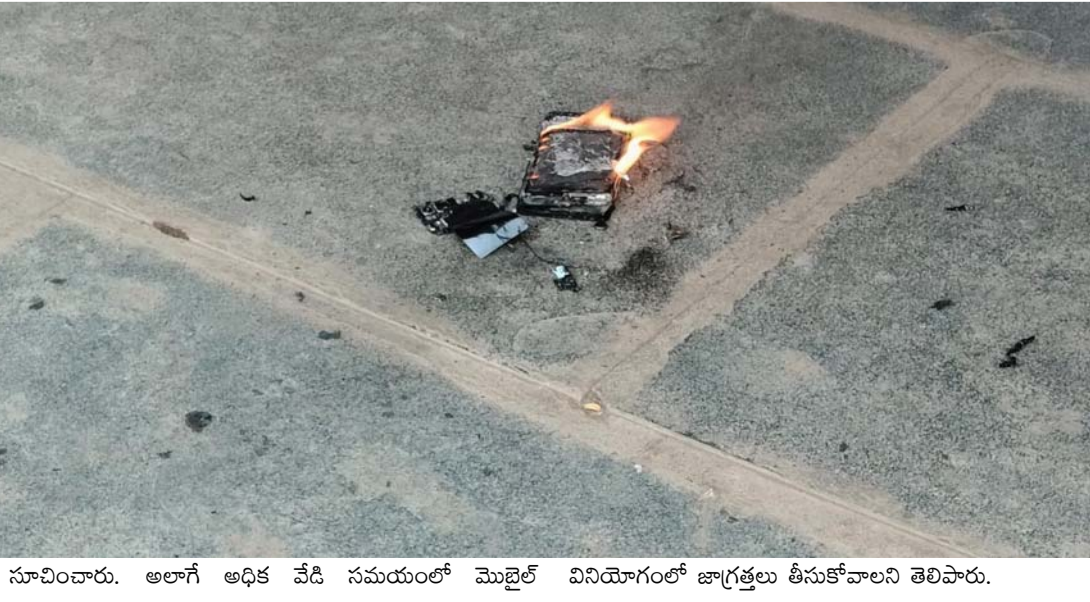
సూచించారు. అలాగే అధిక వేడి సమయంలో మొబైల్ వినియోగంలో జాగ్రత్తలు తీసుకోవాలని తెలిపారు.