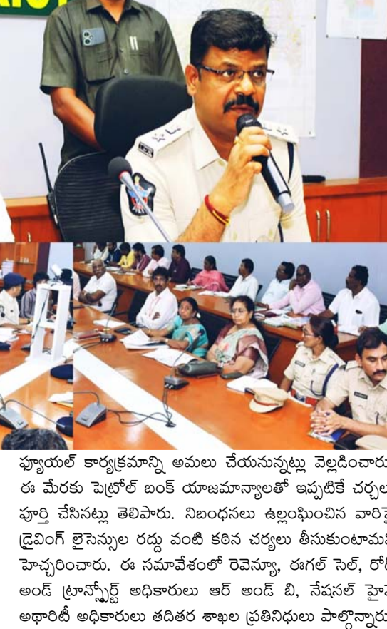
ఫ్యూయల్ కార్యక్రమాన్ని అమలు చేయనున్నట్లు వెల్లడించారు. ఈ మేరకు పెట్రోల్ బంక్ రూజుమాన్యాలతో ఇప్పటికే చర్యలు పూర్తి చేసినట్లు తెలిపారు. నిబంధనలు ఉల్లంఘించిన వారిపై డ్రైవింగ్ లైసెన్సుల రద్దు వంటి కఠిన చర్యలు తీసుకుంటామని హెచ్చరించారు. ఈ సమావేశంలో రెవెన్యూ, కలెక్టర్ సెల్, రోడ్ అండ్ ట్రాన్స్పోర్ట్ అధికారులు ఆర్ అండ్ బి, నేషనల్ హైవే అధారిటీ అధికారులు తదితర శాఖల ప్రతినిధులు పాల్గొన్నారు.

అధారిటీలో కలిసి ప్రమాద ప్రదేశాలను గుర్తించి భద్రతా చర్యలు చేపడుతున్నామని చెప్పారు. ముఖ్యంగా ద్వీచక్ర వాహనదారులు హెల్మెట్ ధరించకపోవడం వల్ల ఎక్కువ ప్రాణనష్టం జరుగుతున్నట్లు గుర్తించినట్లు వెల్లడించారు. ఈ నేపథ్యంలో శిరోరక్ష - ప్రాణరక్ష కార్యక్రమాన్ని అమలు చేస్తున్నామని, పోలీస్ సిబ్బంది సహా ప్రభుత్వ ఉద్యోగులు ముందుగా హెల్మెట్ వినియోగంలో ఆదర్శంగా నిలుస్తున్నారని తెలిపారు. ఇప్పటికే పోలీస్ శాఖలో 100 శాతం హెల్మెట్ వినియోగం అమలులో ఉందన్నారు. ఇతర శాఖల సిబ్బంది కూడా దీనిని తప్పనిసరిగా పాటించాలని సూచించారు. హెల్మెట్ వినియోగాన్ని కట్టుదిట్టం చేసేందుకు మే 1 నుంచి జిల్లా కేంద్రంలో నో హెల్మెట్ నో