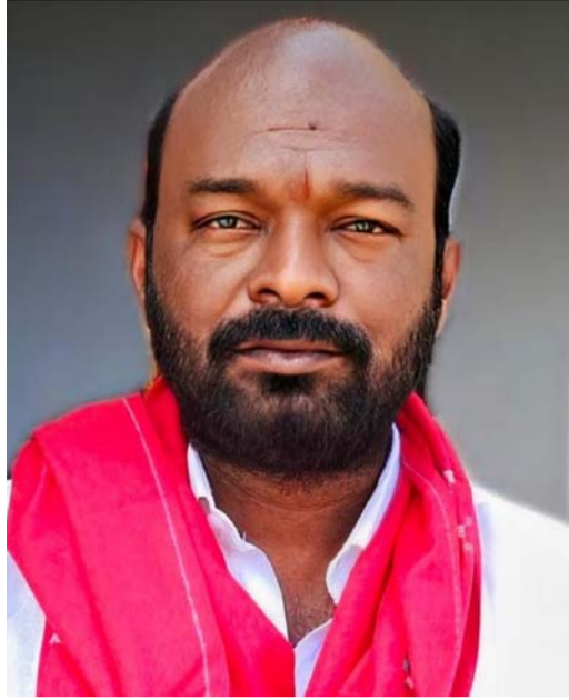
నాలుగు రోజుల కోడలు రద్దు చేయాలి పాత కార్మిక చట్టాలు అమలు చేయాలి