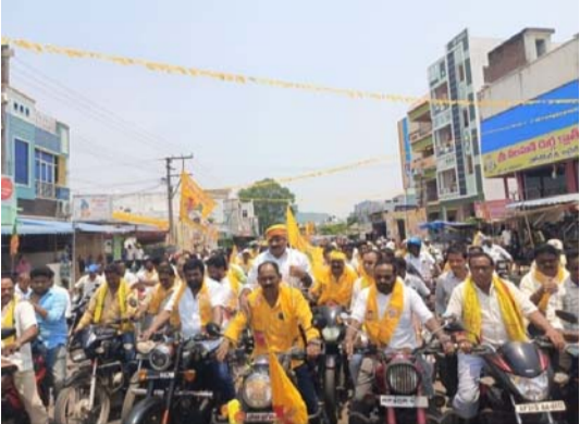
ఎమ్మెల్యే మామిడి గోవిందరావు ఆధ్వర్యంలో అంబరాన్ని అందించిన ముఖ్యమంత్రి 76వ జన్మదిన వేడుకలు.