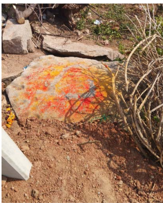
అధికారుల దృష్టికి ఆటు విద్యుత్ అధికారుల పైన మరియు

ఏప్రిల్ 20 ప్రజాజ్యోతి బ్యూరో :- సత్యసాయి జిల్లా రాష్ట్రాదు నియోజకవర్గం రాష్ట్రాదు మండలం లో చాపట్ల గ్రామశి లో ఏకిల మారెప్ప అనే గ్రామస్థుని ఇంటి దగ్గర దాదాపుగా గద్దలయ్య స్వామి కొన్ని సంవత్సరాలు గా కొలువై ఉన్నారు.ఈమధ్య కాలంలో గ్రామంలో గల సింగిల్ పేస్ నూతన విద్యుత్ లైన్ నిర్మిస్తున్నారు.ఇందులో ఇందులో భాగంగా విద్యుత్ అధికారులు మరియు విద్యుత్ కాంట్రాక్టర్ అక్కడ స్వామివారి శిలా విగ్రహం కొలువైంది అని ఏకిల మారెప్ప విద్యుత్ అధికారులకు మరియు విద్యుత్ కాంట్రాక్టర్లు ఎన్నిసార్లు మొరపెట్టుకున్నా కూడా స్వామివారి శిలా విగ్రహానికి అడ్డంగా సింగిల్ లైన్ విద్యుత్ ఫోల్ అడ్డంగా నటించడం జరిగింది.కావున విద్యుత్ అధికారులు మరియు విద్యుత్ కాంట్రాక్టర్లు వెంటనే స్వామివారి శిలా విగ్రహం పక్కనే ఉన్న విద్యుత్ ఫోల్ను పక్కకు మార్చాలిందిగా వేడుకుంటున్నారు. ఈ విషయం పై ఉన్నతాధికారులు చెప్పినా కూడా విద్యుత్ అధికారులు మరియు కాంట్రాక్టర్ నిర్లక్ష్యంగా వ్యవహరిస్తున్నారని ఆగ్రహం వ్యక్తం చేశారు. కావున వెంటనే దేవుని శిలా విగ్రహం పక్కనే నాటిన ఫోస్ కాస్త పక్కకు జరపవలసిందిగా తెలుపుచున్నారు.లేకపోతే మరొకసారి కూడా ఉన్నతాధికా