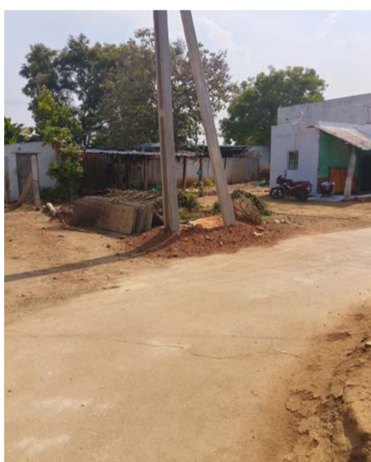
విద్యుత్ కాంట్రాక్టర్ పైన కంపైంట్ ఇస్తామని తెలిపారు.