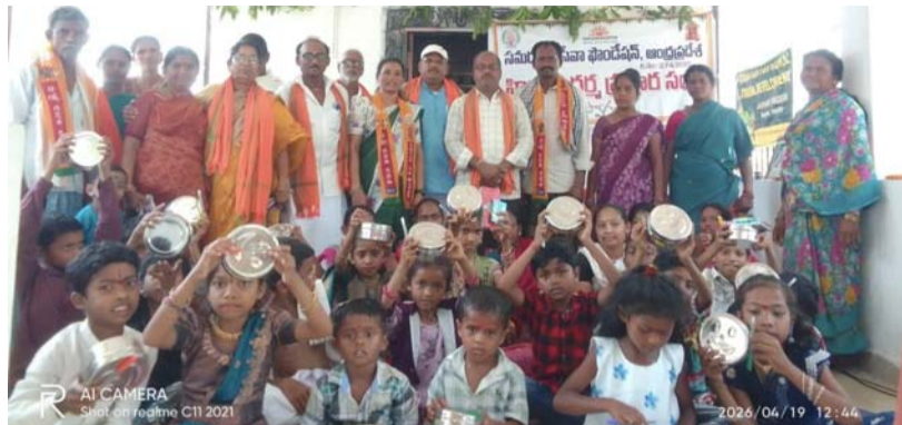
సంస్కృతి, సంప్రదాయాలకు నిలయాలుగా దేవాలయాలు

విద్యార్థుల ప్రదర్శనలు అద్భుతం ధర్మ ప్రచారకుల ప్రశంసలు ఎటపాక, ఏప్రిల్ 19 (ప్రజాజ్యోతి):పోలవరం జిల్లా చింతూరు డివిజన్ ఎటపాక మండలం రాయనపేట పంచాయతీ పరిధి లోని పాతకాండపల్లి గ్రామంలో ఆదివారం ఆధ్యాత్మిక చైతన్యం వెల్లివిరిసింది. తిరుమల తిరుపతి దేవస్థానం శ్రీవాణి ట్రస్ట్ ఆర్థిక సహకారంతో, సమరసత సేవా ఫౌండేషన్ ఆధ్వర్యంలో నిర్వహించిన శ్రీ కోదండ రామస్వామి ఆలయ ప్రాంగణంలో 'బాలవికాస్' వార్షికోత్సవ వేడుకలు ఘనంగా నిర్వహించారు. గత ఏడాది కాలంగా ఆలయాన్ని కేంద్రంగా చేసుకుని 1వ తరగతి నుండి 5వ తరగతి వరకు చదువుతున్న విద్యార్థులకు ప్రతిరోజూ సాయంత్రం 5 నుంచి 7 గంటల వరకు ప్రత్యేక శిక్షణ తరగతులు నిర్వహిస్తున్నారు. ఈ సందర్భంగా వక్రలు