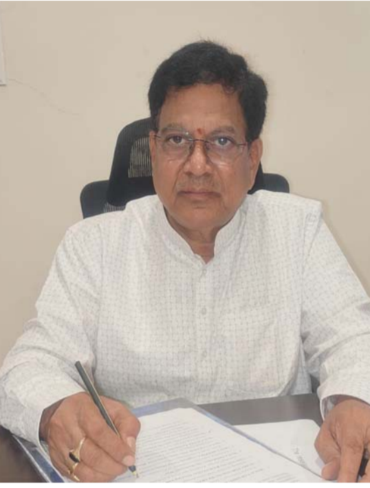
మార్గమని హితువు పలికారు. భారతీయ సంస్కృతి పరిరక్షణ, జాతీయ బంధుత్వ , మన సాంప్రదాయ వారసత్వానికి గౌరవం కల్పించడమే తమ లక్ష్యమని పేర్కొన్నారు.

మాత్రమే కాదని , ఇది భారతదేశ నైతిక విలువలకు, కుటుంబ వ్యవస్థకు, సమాజ నిర్మాణానికి పునాది అని తెలిపారు. శ్రీరాముడి జీవితం ద్వారా ప్రతిఫలించిన ధర్మం, న్యాయం, పాలనా విలువలు సమస్త మానవాళికి మార్గదర్శకంగా నిలుస్తున్నాయన్నారు.భారతీయ కుటుంబ వ్యవస్థ , దాని నైతిక విలువలు, సంప్రదాయాలు, సంస్కృతి , సామాజిక బంధుత్వ న్యాయం, సంక్షేమం ఆధారంగా ఉన్న ప్రజా విధానాలు భారత రాజ్యాంగంలోని మౌలిక హక్కుల ఆత్మ ఇలాంటి బాధ్యతారహిత వ్యాఖ్యలు ప్రజల మధ్య విభేదాలను రగిలించే ప్రమాదం ఉందని, జాతీయ బంధుత్వం దెబ్బతీస్తున్నాయి. ప్రజలకు ఆదర్శంగా ఉండాలన్న ప్రముఖులు ఇలాంటి విషయాలలో మరింత బాధ్యతతో వ్యవహరించాలన్నారు. ఇలాంటి గొప్ప గ్రంథాలపై వ్యాఖ్యలు చేసే ముందు సరైన అధ్యయనం, అవగాహన అవసరమన్నారు. తప్పుదోవ పట్టించే వ్యాఖ్యలు భావోద్వేగాలను దెబ్బతీసేంత మాత్రమే కాకుండా, సత్యాన్ని కూడా వక్రీకరిస్తున్నాయి.ప్రకాష్ రాజ్ ఒక ప్రముఖ నటుడిగా తన ప్రభావాన్ని సమాజానికి మేలుచేసే విధంగా ఉపయోగించాలన్నారు.విభేదాలను పెంచే వ్యాఖ్యలకు బదులు, రామాయణంలోని సత్యం, త్యాగం, కర్మవ్యభేద, ధర్మం వంటి శాశ్వత విలువలను ప్రచారం చేయాలన్నారు. ఆయన వ్యాఖ్యల వల్ల కలిగిన నష్టాన్ని సరిదిద్దడానికి, రామాయణంలోని మహాత్మర విలువలను ప్రతిబింబించే ఒక సార్థక కళాఖండం (సినీమా/నాటకం) రూపొందించడం ఉత్తమ