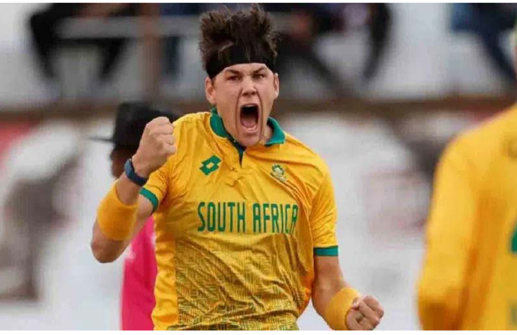
నూపర్ కింగ్స్ను ఢీ కొట్టబోంది. ప్రస్తుతం రెండు మ్యాచ్లలో భారీ తేడాతో గెలిస్తే గుజరాత్ బైటాన్స్ను దాటి పే విజయాలతో ఐదో స్థానంలో కొనసాగుతున్న హైదరాబాద్ ఈ అవకాశముంది.

పంతోమ్మిద్ సీజన్లో బ్యాటర్లే కాదు బౌలర్ల ప్రదర్శనతోనూ విజయాలు సాధిస్తున్న సన్రైజర్స్ హైదరాబాద్ (రాబత్తీఅంపటిం ఎంఎంఐఐఐఐ స్వాగ్డలోకి కొత్త పేసర్ వచ్చాడు. గాయంతో టోర్నీకి దూరమైన డేవిడ్ పైన్ స్థానంలో గెరాల్డ్ కొయెట్టి(+పటిష్టత, జశీమ్ఓవపవని) సన్రైజర్స్ తీసుకుంది. పొట్టి ఫార్మాట్లో రాణిస్తున్న ఈ సఫారీ పేసర్కు స్వాగతం పలుకుతూ ఎక్స్ప్లె పోస్ట్ పెట్టింది యాజమాన్యం. గతంలో ముంబై ఆరెంజ్ ఆర్మీ జెర్నీతో నిప్పులు చెరిగేందుకు సిద్ధమవుతున్నాడు. ఐపీఎల్-19లో సన్రైజర్స్ హైదరాబాద్ కుర్ర బౌలర్లు దుమ్మురేపుతున్నారు. సీనియర్లు హర్షల్ పటేల్, జయదేవ్ ఉనాద్కాట్లు విఫలమవుతున్నా.. మేమున్నామంటూ రాజస్థాన్ రాయల్స్పై మ్యాచ్ విజేతలుగా అవతరించారు ప్రభుత్వ హింగే, షకీబ్ హుస్సేన్. ఇప్పుడు వీరికి తోడుగా రెగ్యులర్ కెప్టెన్ ప్యాట్ కమిన్స్ కూడా చేయి వేయబోతున్నాడు. ఫిట్నెస్ సాధించిన ప్యాట్ సన్రైజర్స్ స్వాగ్డలో చేరడం ఖాయమైన వేళ్.. గాయపడిన పైన్ స్థానంలో గెరాల్డ్ కొయెట్టితో ఒప్పందం చేసుకుంది ప్రాంజెజ్. ఇదివరకూ ముంబై, గుజరాత్ జట్లకు ఆడిన అనుభవమున్న కొయెట్టి రాకతో హైదరాబాద్ పేసర్ దళం మరింత పటిష్టంగా మారింది. రాజస్థాన్పై ఆదిర్ విజయంతో జోషి మీదున్న ఇషాన్ కిషన్ బృందం శనివారం ఉప్పల్ మైదానంలోనే చెన్నై