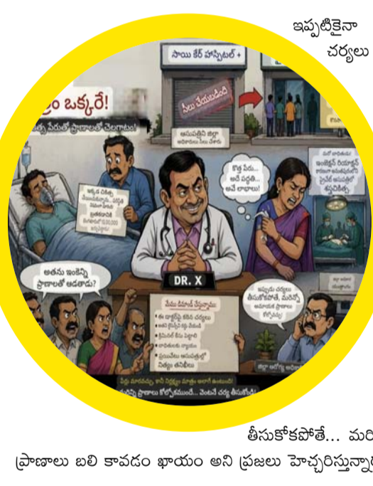
తీసుకోకపోతే... మరెన్ని ప్రాణాలు బలి కావడం ఖాయం అని ప్రజలు హెచ్చరిస్తున్నారు.

చేయించుకోవాల్సి వచ్చినట్లు తెలిసింది. ప్రస్తుతం ఆమె ఆరోగ్యం విషయంలో కుటుంబ సభ్యులు ఆందోళన వ్యక్తం చేస్తున్నారు. ఈ ఘటనలతో పామిడి పట్టణ ప్రజల్లో తీవ్ర ఆగ్రహం నెలకొంది. “పేర్లు మారవచ్చు కానీ డాక్టర్ అదే కదా... ఇలాంటి వైద్యులు ప్రజల ప్రాణాలతో ఆడుకుంటున్నారు” అంటూ స్థానికులు మండిపడుతున్నారు. సీజ్ చేసిన ఆసుపత్రి మళ్ళీ కొత్త పేరుతో కొనసాగుతున్నా అధికారులు కఠిన చర్యలు తీసుకోకపోవడంపై విమర్శలు వెల్లువెత్తుతున్నాయి. వైద్యులంతా ఇలాంటి నిర్లక్ష్యం కొనసాగితే మరెంతమంది ప్రాణాలు ప్రమాదంలో పడతాయోనని ప్రజలు ఆందోళన వ్యక్తం చేస్తున్నారు. సంబంధిత వైద్యునిపై తక్షణమే కఠిన చర్యలు తీసుకోవాలని, ఇలాంటి ఘటనలు పునరావృతం కాకుండా చూడాలని ఉన్నతాధికారులను కోరుతున్నారు.