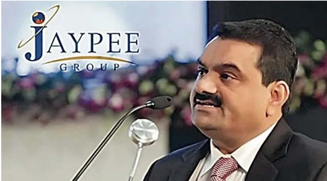
ట్రిబ్యూనల్ ఎన్ సీఎల్ఐ వల్ల ఆక్రమించింది. ప్రస్తుతం దీనిపై నిర్ణయంపై మధ్యతర స్టే విధించడానికి నిరాకరించింది. ఎన్ సీఎల్ఐ వల్ల విచారణ చేపట్టినప్పటికీ, ఎన్ సీఎల్ఐ

స్వాధీనీ: దివాలా తీసిన తమ సంస్థ జేపీఎల్ కొనుగోలుకి సంబంధించి అదానీ గ్రూప్ వైపై జేపీ గ్రూప్ వ్యవస్థాపకుడు జైప్రకాష్ గౌర్ మొగ్గు చూపారు. గౌతమ్ అదానీ సారథ్యంలో గ్రూప్ పురోగమించగలదని విశ్వసిస్తున్నట్లు ఆయన తెలిపారు. రుణదాతల కమిటీ (సీవోసీ), దివాలా పరిష్కార నిపుణుడు పారదర్శకంగా బిడ్డింగ్ ప్రక్రియ నిర్వహించినట్లు గౌర్ పేర్కొన్నారు. ఇందులో పాల్గొన్నందుకు అదానీ గ్రూప్, వేదాంత గ్రూప్ నకు ధన్యవాదాలు తెలిపారు. అదానీ గ్రూప్ ను సీవోసీ ఎంపిక చేయడాన్ని తాను గౌరవిస్తున్నట్లు పేర్కొన్నారు. బిడ్డింగ్ లో తాము గెల్చినట్లు రాతపూర్వకంగా ధృవీకరించిన తర్వాత, దానికి భిన్నంగా అదానీ గ్రూప్ ను విజేతగా ప్రకటించారంటూ పోటీ సంస్థ వేదాంత చీఫ్ అనిల్ అగర్వాల్ ఆరోపించిన నేపథ్యంలో గౌర్ వ్యాఖ్యలు ప్రాధాన్యం సంతరించుకున్నాయి. రూ. 57,185 కోట్ల రుణాలు బాకీ వడటంతో 2024 జూన్ లో జేపీఎల్ పై దివాలా పరిష్కార ప్రక్రియ ప్రారంభమైంది. రూ. 14,535 కోట్ల అదానీ గ్రూప్ బిడ్ కు గతేడాది నవంబర్ లో సీవోసీ ఆమోదించగా, మార్చి 17న నేషనల్ కంపెనీ లా ట్రిబ్యూనల్ (అలపబిఎల్ బెంబ్) కూడా ఆమోదముద్ర వేసింది. అయితే, రూ. 17,926 కోట్లకు బిడ్ చేసిన వేదాంత, దీన్ని సవాలు చేస్తూ అబీలేట్