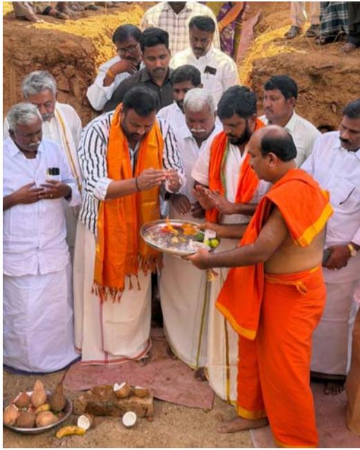
సూతనంగా నిర్విస్తున్న శ్రీ రామాలయం నిర్మాణానికి భూమి పూజ చేస్తున్న మంత్రి మండీపల్లి రాంప్రసాద్ రెడ్డి రామాపురం ఏప్రిల్ 03 ప్రజా జ్యోతి తెలుగుదేశం పార్టీ అధికారంలోకి వచ్చిన తర్వాత వలయాలుకు మహర్షి నెలకొన్నదని రాష్ట్ర మంత్రి మండీపల్లి రాంప్రసాద్ రెడ్డి అన్నారు. ఈరోజు రామాపురం మండలం లోని చిట్టూరు గ్రామం ముసలి రెడ్డి గారి వల్లెలో సుమారు రూ. 40 లక్షల