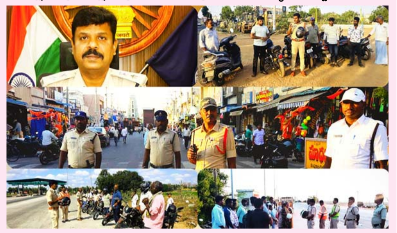
బాపట్ల ఏప్రిల్ 03 ( ప్రజా జ్యోతి జిల్లా ప్రతినిధి ) జిల్లాలో రోడ్డు ప్రమాదాలను తగ్గించేందుకు బాపట్ల జిల్లా పోలీసులు కీలక నిర్ణయం తీసుకున్నారు. ద్విచక్ర వాహనదారులు తప్పనిసరిగా హెల్మెట్ ధరించేలా శిరో రక్ష -- ప్రాణ రక్ష కార్యక్రమాన్ని విస్తృతంగా అమలు చేస్తున్నారు. ఈ నేపథ్యంలో జిల్లా కేంద్రంలో ఏప్రిల్ 16 నుంచి హెల్మెట్ తప్పనిసరి చేయనున్నట్లు జిల్లా ఎస్సీ బి.ఉమామహేశ్వర్ ఐపీఎస్ తెలిపారు. శుక్రవారం జిల్లా వ్యాప్తంగా పోలీసులు ప్రత్యేక అవగాహన కార్యక్రమాలు నిర్వహించి, హెల్మెట్ ధరించడంలో వల్ల కలిగే ప్రయోజనాలను ప్రజలకు వివరించారు. రోడ్డు ప్రమాదాల్లో మరణిస్తున్న వారిలో ఎక్కువ మంది ద్విచక్ర వాహనదారులే ఉండటం ఆందోళనకరమని ఎస్సీ పేర్కొన్నారు. హెల్మెట్ ధరించకపోవడమే ప్రధాన కారణమని స్పష్టం చేశారు. హెల్మెట్ ఉపయోగిస్తే ప్రమాదం జరిగినప్పటికీ తలకు గాయాలు తక్కువగా ఉండి ప్రాణాపాయం నుంచి బయటపడే అవకాశం ఎక్కువగా ఉంటుందని తెలిపారు. ప్రజలు తమ కుటుంబాన్ని దృష్టిలో పెట్టుకుని తప్పనిసరిగా హెల్మెట్ ధరించాలని సూచించారు. ఇప్పటికే ప్రభుత్వ, ఔట్సోర్సింగ్ ఉద్యోగులు విధులకు హెల్మెట్తో రావాలని అన్ని శాఖలకు ఆదేశాలు జారీ చేసినట్లు తెలిపారు. ప్రజలు పోలీస్ శాఖ చర్యలకు సహకరించి రోడ్డు భద్రతలో భాగస్వాములు కావాలని పిలుపునిచ్చారు.

నుంచి కఠిన అమలు శిరో రక్ష -- ప్రాణ రక్ష తో ప్రమాదాల నివారణకు పోలీసుల దృఢ సంకల్పం