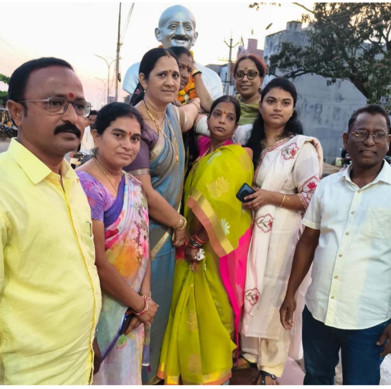
మానుకోవాలని హితవు పలికారు.

లోకి వచ్చాక గాడిలో తప్పిన రాష్ట్రాన్ని తిరిగి గాడిలో పెట్టారన్నారు. అమరావతి నిర్మాణం రాష్ట్ర అభివృద్ధికి అత్యంత ముఖ్యమైనదని, ఈ మేరకు ముఖ్యమంత్రి నారా చంద్రబాబు అమరావతి నిర్మాణం కి అహర్నిశలు కృషి చేస్తున్నారన్నారు. అమరావతి రాజధానిగా లోక్ సభలో అన్ని పార్టీల ప్రతినిధులు ఆమోదం తెలపడం సంతోషకరమని తెలిపారు. కూటమి పాలనలో అమరావతి నిర్మాణ పనులు శరేణంగా జరుగుతున్నాయని గుర్తుచేశారు. పారిశ్రామికంగా రాష్ట్రాన్ని నిలబెట్టేందుకు అమరావతి నిర్మాణం ఒక మైలురాయి అని కొనియాడారు. అమరావతి నిర్మాణానికి కేంద్రం సహకారం అందిస్తుందని వైకాపా నేతలు కల్లెబ్బి మాటలతో ప్రజలను మట్టి పెట్టే ప్రయత్నాలు మానుకోవాలని హితవు పలికారు.