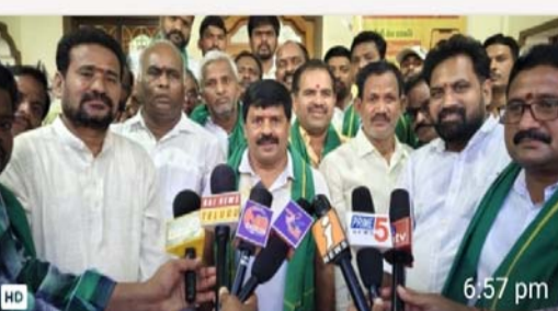
పార్టీ నాయకులు, కార్యకర్తలు పాల్గొన్నారు.