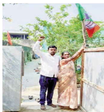
ప్రతి కార్యకర్త చురుకుగా పాల్గొనాలని కోరారు. చొప్పదండి నియోజకవర్గంలో బీజేపీని మరింత బలోపేతం చేసేందుకు ప్రతి కార్యకర్త కృషి చేయాలని, గ్రామ స్థాయి నుండి బూత్ స్థాయి వరకు పార్టీని విస్తరించాలని ఆయన పిలుపునిచ్చారు.

ఆలోచనల ఆధారంగా పార్టీ బలంగా ఎదిగిందని వివరించారు. అలాగే నరేంద్ర మోడీ నాయకత్వంలో కేంద్ర ప్రభుత్వం అమలు చేస్తున్న పథకాలు దేశవ్యాప్తంగా కోట్లాది ప్రజలకు చేరుతున్నాయని తెలిపారు. ప్రజల జీవితాల్లో మార్పు తీసుకొచ్చే విధంగా పేదల సంక్షేమం, గృహ నిర్మాణం, ఉజ్వల గ్యాస్, ఆయుష్మాన్ ఆరోగ్య సేవలు, రైతుల అభివృద్ధి వంటి పథకాలు విజయవంతంగా కొనసాగుతున్నాయని చెప్పారు. ఈ పథకాలను ప్రతి ఇంటికి తీసుకెళ్లడం ప్రతి కార్యకర్త బాధ్యత అని పిలుపునిచ్చారు. జాతీయ పార్టీ పిలుపు మేరకు ప్రతి కార్యకర్త తమ ఇంటిపై బీజేపీ జెండాను ఎగురవేయాలని, అలాగే ఏప్రిల్ 6న ప్రతి పోలింగ్ బూత్లో బీజేపీ జెండా ఎగురవేయాలని అన్నారు. పార్టీ పట్ల గౌరవం, ఐక్యతను చాటే ఈ కార్యక్రమంలో