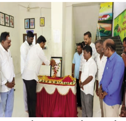
దేశాన్ని విజయపథంలో నడిపించిన ధీశాలి అని కొనియాడారు. అణగారిన వర్గాల అభ్యున్నతి కోసం ఆయన చేసిన కృషి ప్రతి ఒక్కరికీ స్ఫూర్తిదాయకమని పేర్కొన్నారు. ఈ కార్యక్రమంలో వివిధ వార్డుల కౌన్సిలర్లు, మున్సిపల్ అధికారులు మరియు సిబ్బంది పెద్ద సంఖ్యలో పాల్గొని జగ్జీవన్ రామ్ కు ఘనంగా నివాళు లర్పించారు.

గుర్తు చేశారు. జగ్జీవన్ రామ్ కేంద్ర మంత్రిగా ఉన్న సమయంలో దేశ గమనాన్ని మార్చే అనేక అభివృద్ధి కార్యక్రమాలకు శ్రీకారం చుట్టారని చైర్మన్ వివరించారు. ముఖ్యంగా కార్మిక శాఖ మంత్రిగా ఉన్నప్పుడు కార్మికుల సంక్షేమం కోసం కనీస వేతనాల చట్టం మరియు భవిష్య నిధి వంటి విప్లవాత్మక సంస్కరణలు తీసుకువచ్చారన్నారు. అలాగే వ్యవసాయ మంత్రిగా హరిత విప్లవానికి నాంది పలికి దేశం అహార ధాన్యాల కోసం ఇతర దేశాలపై ఆధారపడకుండా స్వయం సమృద్ధి సాధించడంలో కీలక పాత్ర పోషించారని తెలిపారు. రక్షణ మంత్రిగా 1971 భారత్-పాక్ యుద్ధ సమయంలో