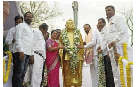
సంస్థ అధ్యక్షుడు, పట్టణ ప్రజాప్రతినిధులు, దళిత సంఘాల నాయకులు, ప్రభుత్వ అధికారులు, కాంగ్రెస్ నాయకులు, కార్యకర్తలు మరియు పలువురు ప్రజలు పాల్గొన్నారు.