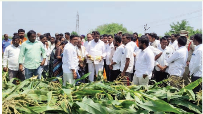
గొల్లపల్లి ఏప్రిల్ 01 ప్రజాజ్యోతి

ఇటీవల కురిసిన ఆకాల వర్షాలకు దెబ్బతిన్న పంటలకు యుద్ధ ప్రాతిపదికన అంచనాలు తయారు చేయాలని రాష్ట్ర సాంఘిక సంక్షేమ మంత్రి అడ్డూరి లక్ష్మణ్ కుమార్ అధికారులను ఆదేశించారు. బుధవారం జగిత్యాల జిల్లా గొల్లపల్లి మండలం బింరాజు పల్లి గ్రామంలో ఆకాల వర్షాలకు దెబ్బతిన్న పంటలను మంత్రి లక్ష్మణ్ కుమార్ వ్యవసాయ అధికారులతో కలిసి బుధవారం పరిశీలించారు. ఈ సందర్భంగా మంత్రి లక్ష్మణ్ కుమార్ మాట్లాడుతూ ఆకాల వర్షాలకు జగిత్యాల జిల్లాలో 6160 ఎకరాల్లో మామిడి పంట, 1029 ఎకరాల్లో వరి 1520 ఎకరాల్లో మొక్కజొన్న, 581 ఎకరాల్లో నువ్వు పంటలు దెబ్బ తిన్నట్లు అధికారులు ప్రాథమిక అంచనా వేశారని మంత్రి తెలిపారు. పంటలు నష్టపోయిన ప్రతి రైతుకు పరిహారం చెల్లించడానికి ప్రభుత్వం సిద్ధంగా ఉందని మంత్రి తెలిపారు. పెట్టుబడులు పూర్తి పంట చేతికి వచ్చే సమయంలో ఇలా నష్టపోవడం చాలా బాధాకరమని మంత్రి అన్నారు. అధికారులు నష్టపోయిన ప్రతి రైతుకు పరిహారం వచ్చే విధంగా అంచనాలు రూపొందించి నివేదికను పంపించాలని మంత్రి ఆదేశించారు.