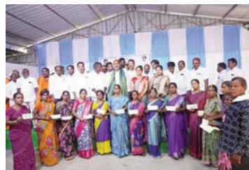
చేస్తుందని మేడిపల్లి సత్యం అన్నారు.

మహిళలు ఆర్థికంగా ఎదగడానికి మహిళా సంఘాలు ఎంతగానో తోడ్పడుతున్నాయని మహిళల అభ్యున్నతి లక్ష్యంగా కాంగ్రెస్ ప్రభుత్వం పని