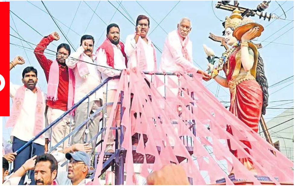
కుమ్రం భీం ఆసిఫాబాద్

కేసీఆర్ తెలంగాణను దేశంలోనే నంబర్ వన్ గా నిలిపారని ప్రశంసలు