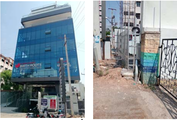
నిర్మాణానికి ఈ అనుమతులన్నీ అవసరం.

మున్సిపాలిటీ నుండి కమర్షియల్ భవన నిర్మాణానికి టౌన్ ప్లానింగ్ నుండి అనుమతి, అగ్నిమాపక శాఖ నుండి ఆసుపత్రి అనుమతికి ఎన్.ఓ.సి., ట్రేడ్ లైసెన్స్, శానిటేషన్ సర్టిఫికేట్, టిఎస్ ఎన్సిడి.సి.ఎల్ నుండి సపరేట్ ఎలక్ట్రిసిటీ కనెక్షన్ పర్మిషన్, మున్సిపాలిటీ వాటర్ కనెక్షన్, సేవర్జీ పర్మిషన్, తెలంగాణ పొల్యూషన్ కంట్రోల్ బోర్డ్ అనుమతి, బయో మెడికల్ వేస్ట్ డిస్పోజల్ అనుమతి, బయో మెడికల్ వేస్ట్ ఆధరక్షేపణ, లిఫ్ట్ ఇన్స్పెక్టర్ అనుమతి అంతేకాకుండా హెల్త్ క్లినికల్ ఎస్టాబ్లిష్మెంట్ లైసెన్స్ సర్టిఫికేట్. ప్రైవేట్ ఆసుపత్రి