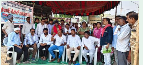
మాట్లాడుతూ రాష్ట్ర ప్రజలకు నిరంతర సేవలు అందిస్తున్న ఆర్టీసీ కార్మికుల సమస్యలను ప్రభుత్వం పరిష్కరించకపోవడం దారుణమన్నారు. ఆర్టీసీ కార్మికుల న్యాయమైన డిమాండ్లను వెంటనే నెరవేర్చాలని, కార్మికులు చేపట్టిన సమ్మెకు తమ సంపూర్ణ మద్దతు ఉంటుందని స్పష్టం చేశారు.