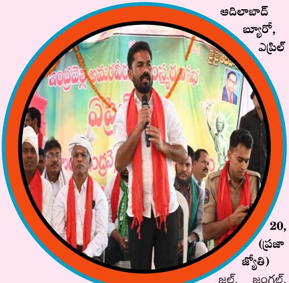
ఆదిలాబాద్ బ్యారో, ఎప్రిల్

అధికారిక స్మరణం- ఆదివా సీల సంబరం 45 ఏళ్ల తర్వాత ఇంద్రవెల్లిలో స్వేచ్ఛగా ఘణంగా నివాళి అమరుల త్యాగాలను స్మరించుకున్న నేతలు