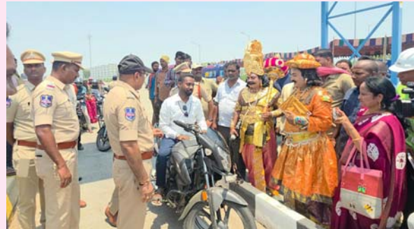
మందమరి టోల్ ప్లాజా వద్ద రోడ్డు భద్రతపై అవగాహన కార్యక్రమం - గోల్డెన్ అవర్, సీసీఆర్ ప్రాముఖ్యత వివరించు.