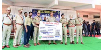
ప్రమాదాలను నివారించాలి - ప్రాణ నష్టాన్ని తగ్గించాలి

"అభయ మై టాక్సీ ఇస్ సేఫ్ 2.0" కార్యక్రమం లాంఛనంగా ప్రారంభించిన రాష్ట్ర డిజిపి జిల్లా వ్యాప్తంగా పథకంలో నమోదు చేసుకున్న 5000 ఆటోలు 500 ఆటో డ్రైవర్లతో ప్రత్యేక సమావేశం తెలంగాణ రాష్ట్ర డిజిపి బి. శివధర్ రెడ్డి ఐపీఎస్ ఆదిలాబాద్ బ్యూరో, ఏప్రిల్ 13, (ప్రజా జ్యోతి) రాష్ట్రవ్యాప్తంగా రోడ్డు ప్రమాదాలను, ప్రమాదాలలో మరణాలను తగ్గించేందుకు రాష్ట్ర డిజిపి బి. శివధర్ రెడ్డి అలోచన కార్యక్రమం "అరెవ్ అలైవ్". ఇందులో భాగంగానే ఆదిలాబాద్ జిల్లాలో విస్తృతంగా అవగాహన కార్యక్రమాలు నిర్వహిస్తూ ప్రజలలో రోడ్డు ప్రమాదాలపై, వారు చేసే నిర్లక్ష్యాలను, రోడ్డు భద్రత నియమాలను తెలియజేస్తూ ప్రజలను చైతన్య పరుస్తూ, ప్రమాదాలను అరికట్టడం, నివారించడం జరుగుతుంది. జిల్లాలో మొట్టమొదటిసారిగా ఆటో డ్రైవర్లకు "అభయమై టాక్సీ ఇస్ సేఫ్" అనే కార్యక్రమాన్ని గత సంవత్సరం ప్రారంభించగా, సోమవారం స్థానిక ఇందిరా ప్రియదర్శిని స్టేడియం వద్ద రాష్ట్ర డిజిపి బి