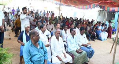
కలెక్టర్ అభిలాష అభినవ్

నిర్మల్ జిల్లా ప్రతినిధి ,ఎప్రిల్ 13 ,( ప్రజాజ్యోతి ).ప్రజలు ట్రాఫిక్ నియమాలపై అవగాహన పెంచుకోవాలని జిల్లా కలెక్టర్ అభిలాష అభినవ్ అన్నారు.సోమవారం సాయంత్రం సారంగాపూర్ మండలం ధని గ్రామంలో 'ప్రజా పాలన-ప్రగతి ప్రణాళిక' కార్యక్రమంలో భాగంగా గ్రామసభ ఏర్పాటు చేసి, అరెస్ట్ లైవ్ కార్యక్రమం నిర్వహించి గ్రామస్తులకు రోడ్డు భద్రత, ట్రాఫిక్ నియమాలపై అవగాహన కల్పించారు. ఈ కార్యక్రమంలో జిల్లా కలెక్టర్ అభిలాష అభినవ్, ఎస్పీ జానకి షర్మిలతో కలిసి పాల్గొన్నారు. వీరికి గ్రామస్తులు పూల మొక్కలు అందించి, స్వాగతం పలికి శాలువాలతో సన్మానించారు ఈ కార్యక్రమంలో భాగంగా జిల్లా కలెక్టర్ అభిలాష అభినవ్ మాట్లాడుతూ, ప్రజల్లో రోడ్డు భద్రత పై అవగాహన కల్పించాలని ఉద్దేశ్యంతో ప్రజా పాలన-ప్రగతి ప్రణాళిక కార్యక్రమంలో భాగంగా గ్రామసభ ఏర్పాటు చేసి, అరెస్ట్ లైవ్ వారోత్సవాల కార్యక్రమం నిర్వహిస్తున్నట్లు వివరించారు. ప్రతిరోజూ రోడ్డు ప్రమాదాలలో ఎంతో మంది ప్రజలు ప్రాణాలు కోల్పోతున్నారని, ప్రతి ఒక్కరు ట్రాఫిక్ నియమాలు పాటించడం ద్వారా రోడ్డు ప్రమాదాలను తగ్గించుకోవచ్చు అని అన్నారు. గ్రామంలో రోడ్డు ప్రమాదాల