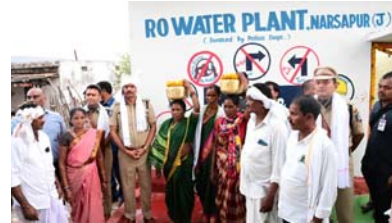
మెగా వైద్య శిబిరంతో సేవలు కలుషిత నీటితో సతమవుతున్న ఆదివాసీలకు ఆర్.వో. ప్లాంట్ అందజేత