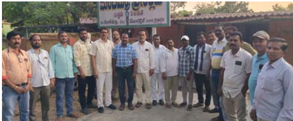
అంబేద్కర్ ఆలోచన పరుల వేదిక పిలుపు