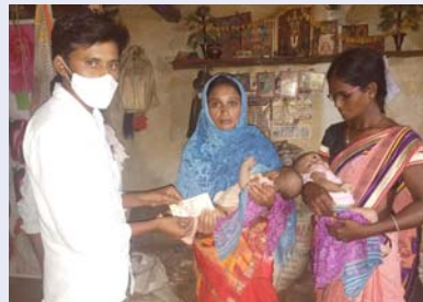
పేదలంటే ఆయనకు పంచ ప్రాణం రోగులంటే అక్కన చేర్చుకునే తత్వం ఆయన సంపాదనలో సగం పేదలకే పంపిణీ అపదలో ఆదుకునే తత్వం పేదవాడే అయినా యువతకు ఆదర్శం