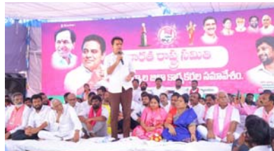
: కేటీఆర్ హెచ్చరిక