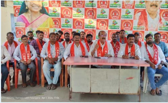
KATI SQCHI Ramayadahi Telangana Apr 7, 2026, 17:06