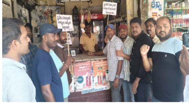
ఉద్యోగాలు కోల్పోయి రోడ్డున పడ్డ ప్రైవేట్ సెక్యూరిటీ గార్డులు

మంచెర్యాల ప్రతినిధి ఏప్రిల్ 8 ప్రజా జ్యోతి: వృత్తినే జీవనాధారంగా మలుచుకొని కుటుంబాలను పోషించుకుంటున్న ఆ ప్రయివేట్ సెక్యూరిటీ గార్డ్ లకు కాంట్రాక్టర్ చేసిన తప్పిదం పెనుశాపంగా మారింది. ఒక్క సారిగా ఉద్యోగాలు కోల్పోయి దిక్కు తోచని స్థితిలో పడ్డారు. పిల్లలు చదువులు, కుటుంబ పోషణకు చేసిన అప్పులు కుటుంబ పోషణ పెనుభారంగా మారాయి. అన్నమో రామచంద్ర అని గత రెండు నెలలుగా ఉద్యోగ అవకాశం కల్పించాలని అధికారులను వేడుకుంటున్న పట్టించుకునే నాడుడే కరువయ్యాడు. అందగా నిలువాల్సిన పాలకులు కనీస పట్టించు చేయడం లేదు. సారు మా గోడు వినండిని వేడుకుంటున్న సింగరేణి ప్రయివేట్ సెక్యూరిటీ గార్డ్ గత మూడు రోజులుగా చేస్తున్న నిరసన కార్యక్రమంలో భాగంగా బుధవారం మండమరి మార్కెట్ లో బిక్షాటన చేస్తూ వినూత్న కార్యక్రమాలు చేపట్టారు. వీరి దీన స్థితి పై ప్రజా జ్యోతి కథనం..... రెండు నెలలుగా ఉద్యోగాలు లేకుండా తీవ్ర ఇబ్బందులు పడుతున్నామని, తమ కుటుంబాలు రోడ్డున పడే పరిస్థితి వచ్చిందని సింగరేణి కాలరీస్ కంపెనీ లిమిటెడ్లో పనిచేసిన ప్రైవేట్ సెక్యూరిటీ గార్డులు ఆవేదన వ్యక్తం చేస్తున్నారు. గత 12 సంవత్సరాలుగా సింగరేణి సంస్థలో ప్రైవేట్ సెక్యూరిటీ గార్డులుగా