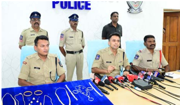
డబ్బుపై వ్యామోహంతో కూ తురితో కలిసి దొంగతనం చే సిన మహిళ ఇచ్చోడ పోలీస్ స్టేషన్ లో కేసు నమోదు

100% రికవరీ పది తులాల బంగారం, పది తులాల వెండి రికవరీ