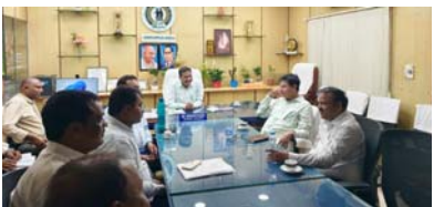
పర్యావరణ షరతుల అమలు, అభివృద్ధి పనులపై సమగ్ర తనిఖీ