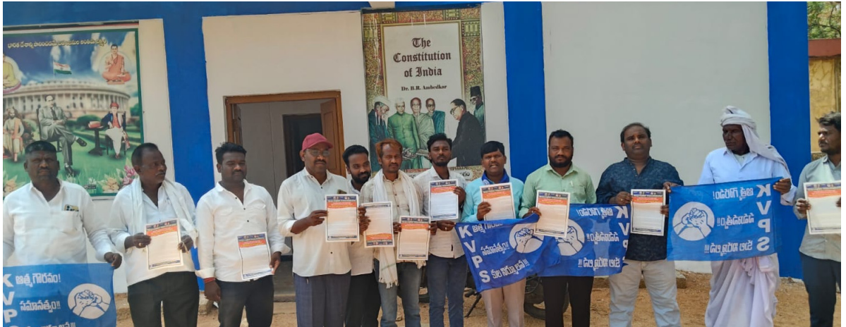
నారాయణభేడ్, ప్రజాజ్యోతి ఏప్రిల్ 8: