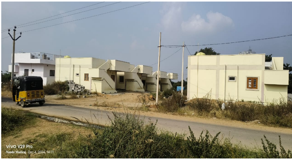
Vivo V29 Pro Nandu Midiraj Dec 4, 2024, 14:11