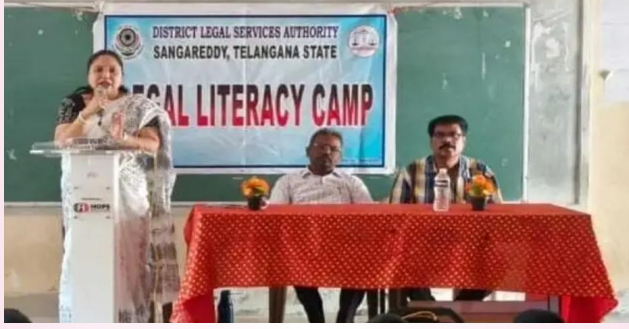
కొండాపూర్ ప్రజా జ్యోతి :