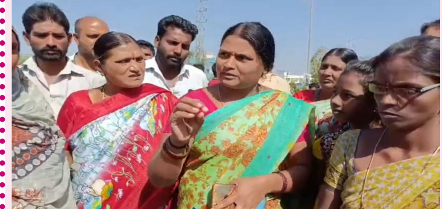
అందోలు, ఏప్రిల్ 07, (ప్రజాజ్యోతి): మోరీల

నిర్మాణాన్ని అడ్డుకుంటే మా నివాసం ఎట్లా? అంటూ మీడియా ముఖంగా అధికారులను డబల్ బెడ్ రూమ్ ఇండ్ల లబ్ధిదారులు ప్రశ్నించారు. ఈ సందర్భంగా తమ కాలనీలో మౌలిక వసతుల కల్పన చేయలంటూ మంగళవారం డబల్ బెడ్ రూమ్ ఇండ్ల లబ్ధిదారులు రోడ్డుపై బైరాయించి తమ నిరసనను వ్యక్తం చేశారు. కావాలనే కొందరు వ్యక్తులు మోరీల నిర్మాణం జరగకుండా అడ్డుకుంటున్నారని ఆవేదన వ్యక్తం చేశారు. మురికి కూపంగా డబల్ బెడ్ రూమ్ కాలనీ మారినదని దీంతో ఈ ప్రాంతంలో దోమల బెడద ఎక్కువై విష జ్వరాలు ప్రబలుతున్నాయని, తరచూ ప్రజలు రోగాల బడిన పడుతూ ఆర్థికంగా ఇబ్బందులు ఎదుర్కొంటున్నారన్నారు. ఇదే విషయమై పలుమార్లు ఎమ్మార్వో కు, కలెక్టర్ ను కలిసి వినతి పత్రం అందజేసినా ఫలితం లేకుండా పోయిందని, రాజకీయ నాయకులను కలిసి తమ గోడు వినిపించుకున్నా పట్టించుకునే నాధుడే లేడని వాపోయారు. అందోలు, జోగిపేట అనే భేద భావాలు తీసుకొస్తూ మోరీల నిర్మాణాన్ని అడ్డుకుంటున్నారని ఇదే కొనసాగితే తమ ఇళ్ల పట్టాలు జోగిపేటకు మార్చాలని డిమాండ్ చేశారు. లేని పక్షంలో మోరీల నిర్మాణమైనా చేపట్టి తమ కాలనీని నివాసయోగ్యంగా మార్చాలని కోరారు. రాజకీయ దురుద్దేశంతో కక్ష సాధింపు చర్యలు సహేతుకం కాదని, మేము వ్యక్తిగతంగా ఎవరిపైనా ఆరోపణలు చేయదలచుకోలేదని మా సమస్యకు పరిష్కారం లభిస్తే అంతే చాలని అన్నారు. ఈ నిరసన కార్యక్రమంలో డబల్ బెడ్ రూమ్ ఇండ్ల లబ్ధిదారులు, స్థానిక ప్రజలు పాల్గొన్నారు.