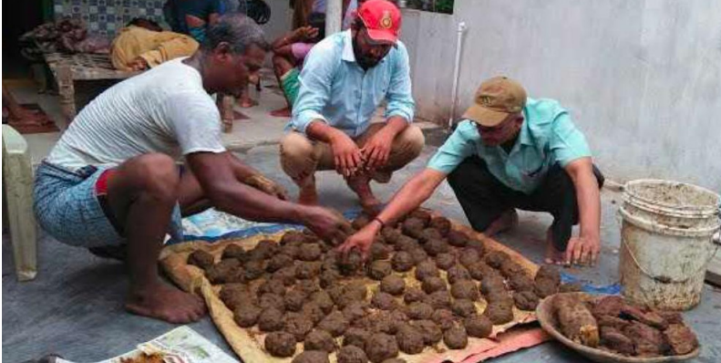
కల్వర్ 5. 7. ఏప్రిల్. ప్రజా జ్యోతి:

- ప్రొఫెసర్ రమేష్ చంద్ వ్యవసాయ ఆర్థిక వేత్త -వ్యవసాయ రైతులకు. ప్రకృతి సేద్యం జీవామ్మతం పై అవగాహన శిక్షణ -48 గంటల పులిస్తే చాలు జీవామ్మతం ఎరువు తయారవుతుంది