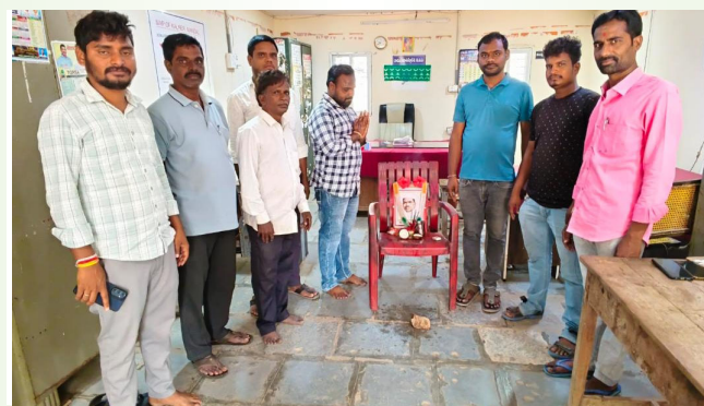
కల్వ 5. 5. ఏప్రిల్ ప్రజా జ్యోతి.

సంగారెడ్డి జిల్లాలోని మండల కేంద్రమైన కల్వర్లోని ప్రతి గ్రామంలో ఊరువాడ తేడా లేకుండా దళిత బంధు పేదల పెన్నిధి ఆశాజీవి. దేశ మాజీ ఉప ప్రధాని డాక్టర్ బాబు జగ్జీవన్ రామ్ జయంతిని మండల కేంద్రం తాసిల్దార్ కార్యాలయంలో నిర్వహించారు. మండల కేంద్రంలోని ప్రతి గ్రామంలో వాడ తేడా లేకుండా ప్రతి ఒక్కరూ కలిసికట్టుగా మహానుభావుడైన డాక్టర్ జగ్జీవన్ రామ్ నిర్వహించుకున్నారు భారత దేశానికి చేసిన సేవలను. స్వతంత్ర పోరాటంలో మరియు అంటరానితనం సమస్యను రూపుమాపణలో ఉండి ప్రతి ఒక్కరికి అందరూ ఒక్కటే అని నినాదాన్ని గుర్తించిన మొదటి వ్యక్తి. అడుగుజాడల్లో నడవాలని వక్రలు యువతకు సూచించారు.