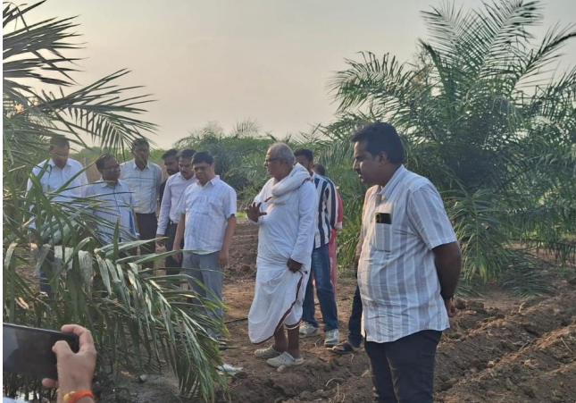
కొండాపూర్ ప్రజా జ్యోతి

కొండాపూర్ మండలంలో వ్యవసాయ శాఖ ప్రధాన కార్యదర్శి పర్యటన..