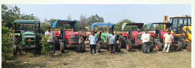
కొండాపూర్ ప్రజా జ్యోతి