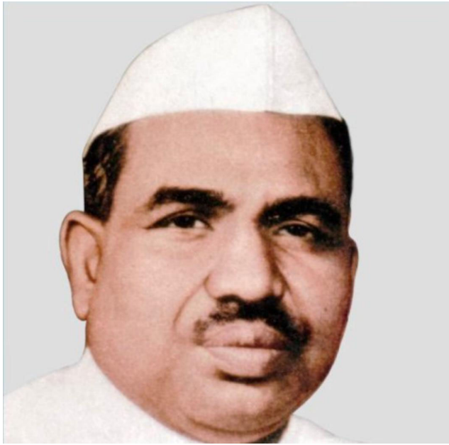
కర్ణాటక 5. ఏ.పి.టి. ప్రజా జ్యోతి.

డాక్టర్ బాబు జగ్జీవన్ రామ్ (బాబూజీగా పిలవబడే) భారత స్వాతంత్ర్య సమరయోధుడు, దళిత నాయకుడు, దీర్ఘకాలిక కేంద్ర మంత్రి మరియు 1979లో ఉపప్రధాని. బీహార్ లో చమార్ కులంలో జన్మించిన ఆయన జీవితం సామాజిక న్యాయం, కుల వివక్షకు వ్యతిరేక పోరాటానికి చిహ్నం. ?