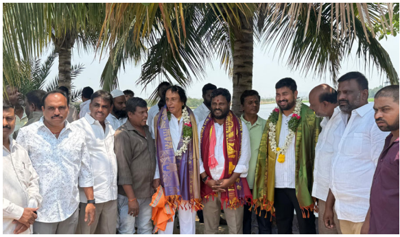
పటాన్ చెరు/ ప్రజాజ్యోతి

-తిమ్మక్క చెరువుకు పునర్జన్మ... మత్స్యకారుల జీవితాల్లో వెలుగు