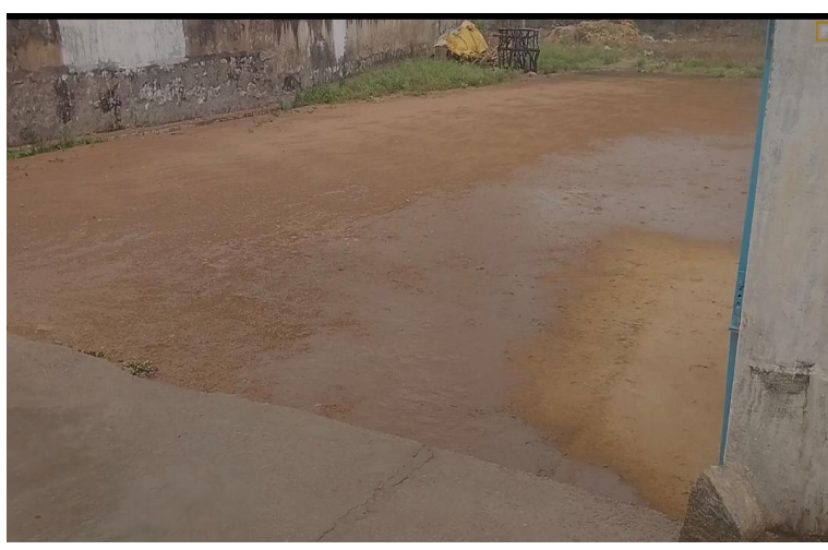
కల్వే రి.4.ఏప్రిల్. ప్రజా జ్యోతి:

వరి కోత. జొన్న పంటల రైతుల గుండెల్లో ఆందోళన