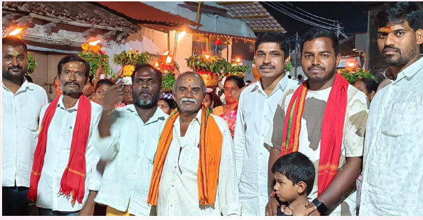
ప్రజాజ్యోతి రేగోడ్ (ఏప్రిల్ 27):

అబ్బురపలచిన శివశక్తుల యేసయ్య బోనం విన్యాసాలు