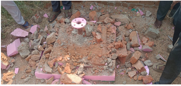
కొడిపల్లి ప్రజా జ్యోతి ఏప్రిల్ 27: