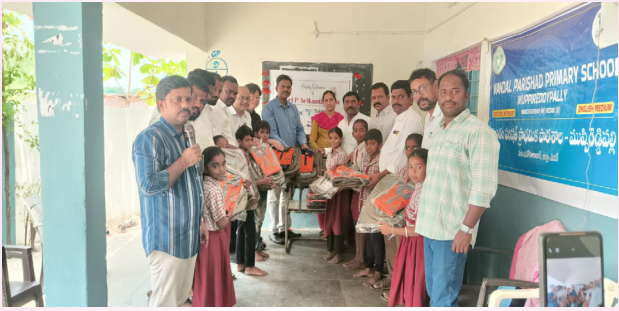
మనోహరాబాద్, ఏప్రిల్ 22 ( ప్రజా జ్యోతి ):