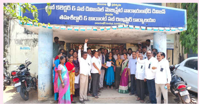
నారాయణఖేడ్, ప్రజాజ్యోతి ఏప్రిల్ 17:

టీ.జీ.ఈ.జే.పి.సీ దళవారి పోరాట కార్యక్రమంలో భాగంగా నారాయణఖేడ్ మండలంలో ఉద్యోగులు, ఉపాధ్యాయులు, పెన్షనర్లు, కాంట్రాక్ట్, ఔట్రీచ్ సిబ్బంది నల్ల బ్యాడ్జిలు ధరించి మధ్యాహ్న భోజన విరామ సమయంలో నిరసన చేపట్టారు. సమస్యలు పరిష్కరించాలని శుక్రవారం తహసీల్దార్ కు వినతిపత్రం సమర్పించారు. ఈ సందర్భంగా వారు మాట్లాడుతూ.. ఉద్యోగుల పెండింగ్ సమస్యలను వెంటనే పరిష్కరించాలని, రెండో పీఆర్సీ నివేదికను అమలు చేసి 51 శాతం ఫీటేమెంట్ ప్రకటించాలని డిమాండ్ చేశారు. అలాగే సీపీఎస్ను రద్దు చేసి ఓపీఎస్ పునరుద్ధరించాలని, హెల్త్ కార్డులు మంజూరు చేయాలని కోరారు. ఈ కార్యక్రమంలో టీజీఈజేపీసీ నాయకులు, ఉపాధ్యాయులు, వివిధ సంఘాల ప్రతినిధులు పాల్గొన్నారు.