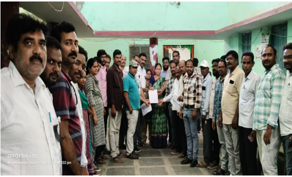
మరిపెడ, ఏప్రిల్ 17 (ప్రజాజ్యోతి):

తెలంగాణ ఉద్యోగ, గెజిటెడ్ అధికారుల, ఉపాధ్యాయుల, కార్మిక మరియు పెన్షనర్స్ జాయింట్ యాక్షన్ కమిటీ టీజీఈ జేపీసీపిలుపు మేరకు ఉద్యోగులు తమ దీర్ఘకాలంగా పెండింగ్లో ఉన్న సమస్యలను పరిష్కరించాలని కోరుతూ మరిపెడ మండల తహసీల్దార్ కు శుక్రవారం వినతిపత్రం సమర్పించారు. ఈ సందర్భంగా ఉద్యోగ సంఘాల ప్రతినిధులు మాట్లాడుతూ ప్రభుత్వ ఉద్యోగులకు సంబంధించిన ముఖ్యమైన నాలుగు డిమాండ్లను తక్షణమే అమలు చేయాలని ప్రభుత్వాన్ని కోరారు. ముఖ్యంగా రెండవ వేతన సవరణ సంఘం పిఆర్సిన