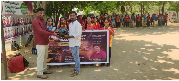
కేసముద్రం, ఏప్రిల్ 15 (ప్రజాజ్యోతి):