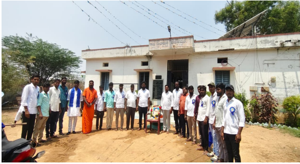
వెల్పర్తి (ప్రజాజ్యోతి) ఏప్రిల్ 14: