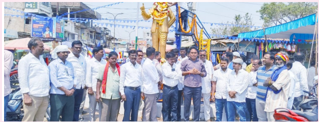
నారాయణఖేడ్, ప్రజాజ్యోతి ఏప్రిల్ 14: